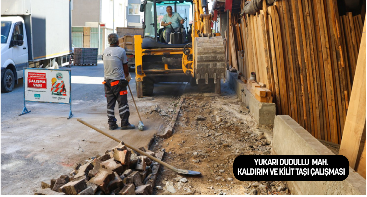
YUKARI DUDULLU MAH. KALDIRIM VE KİLİT TAŞI ÇALIŞMASI