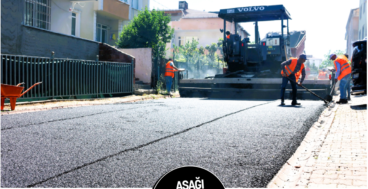
AŞAĞI DUDULLU MAH. DERSADET SOK.