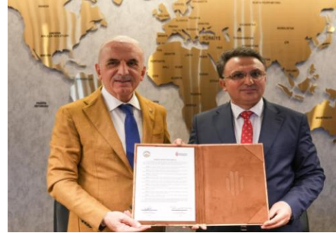
Sivas – Yıldızeli Belediyesi ile Kardeş Şehir Protokol İmza Töreni