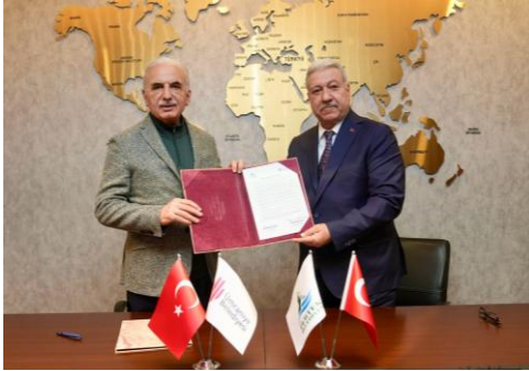
Tunceli - Pertek Belediyesi ile Kardeş Şehir Protokol İmza Töreni