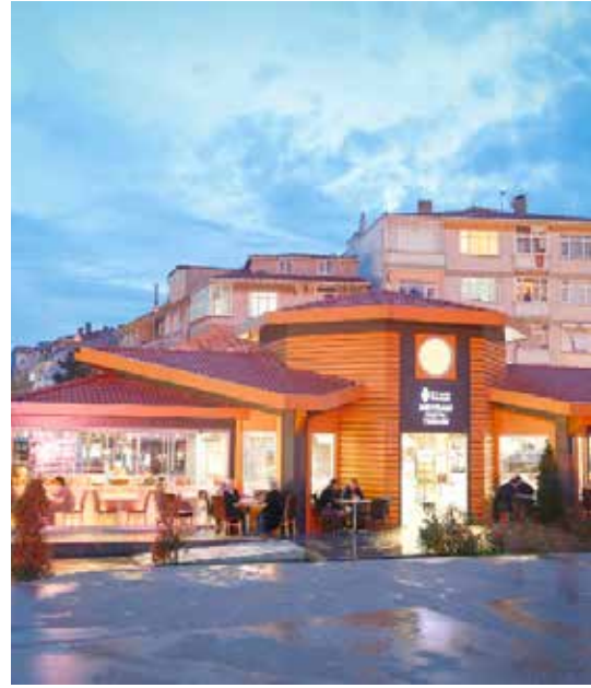
Meydan Sosyal Tesisleri