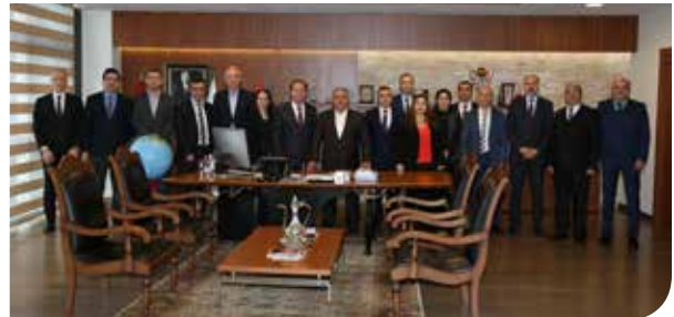
AYEDAŞ Yetkilileriyle İstişare Toplantısı