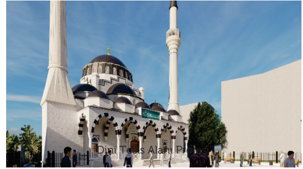
Dini Tesis Alanı Projesi