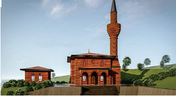
Dini Tesis Alanı Projesi