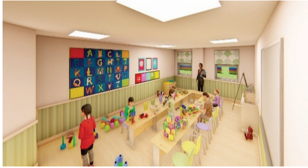
Eğitim Yapıları Projesi