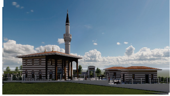
Dini Tesis Alanı Projesi