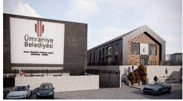
Kurban Kesim Yeri