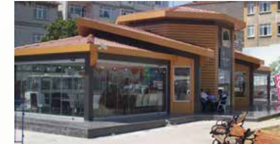
» Meydan Sosyal Tesisleri

2015 yılında belediyemizin kira ve ecr-i misil gelirleri tahakkuku Toplam 7.105.165,00 TL dir.