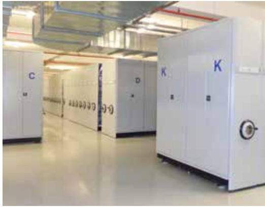
» Fiziki Arşiv

Kayıt altına alınan evrakların yanı sıra müdürlüğümüzde dijital arşivin gün ve gün aktif kullanılmaya teşvik edilmesiyle 2015 yılında, 28.122 adet gerek telefondan gerek şifahi dosya incelemesi ve 33.701 adet şifahi imar durumu bankolarından yapılan bilgilendirmeler sonucunda işlem hacminin azalması, aksine iş süreç verimliliğinin arttığı anlaşılmaktadır.