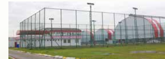
» Hekimbaşı Spor Tesisleri