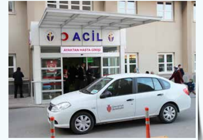
» Binek Araç ile Hasta Nakli - Ümraniye Devlet Hastanesi

Yatalak durumda olmayıp kendi olanakları ile sağlık kurum ve hizmetlerine erişim imkânı bulunmayan hasta vatandaşlarımız için binek araç tahsis edilerek ulaşım ihtiyaçları karşılanmış; mağdur, yaşlı ve kimsesizlerin hastaların daima elinden tutulmuştur. 2013 Yılı içinde kayıtlı 60 vatandaşımız için gidiş - dönüş 643 adet/sefer binek araç hasta nakil hizmeti sunulmuştur.