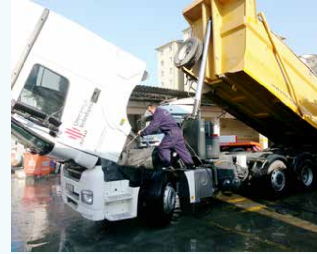
» Kademe Bakım-Onarım Çalışmaları

Kademe Birimlerimiz, faaliyetleri gerçekleştirirken; işletme maliyetlerinin minimumda tutulması, hızlı ve kaliteli müdahale, kayıt sisteminin düzgün işletilmesi hususlarına azami özen göstermektedir.