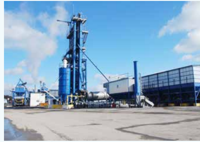
» Asfalt Üretim Tesisi

Asfalt tesisimiz, sadece doğalgaz kullanması bakımından çevreye duyarlı ve örnek bir tesis olup bünyesindeki Asfalt Üretim ve Takip Otomasyon Sistemi ile asfalt üretim ve çıkışlarının dijital ortamda anlık kontrol ve takibi sağlanmıştır.