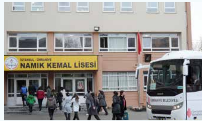
» Okullara Araç Desteği - Namık Kemal Lisesi

2013 yılında ilçemizde bulunan ilköğretim okulları ve liselerin eğitim ve kültürel amaçlı faaliyetlerinde 687 adet/sefer araç görevlendirilmiş; bu sayede hem okullarımıza hem de velilerimize önemli ölçüde katkı sağlanmıştır.