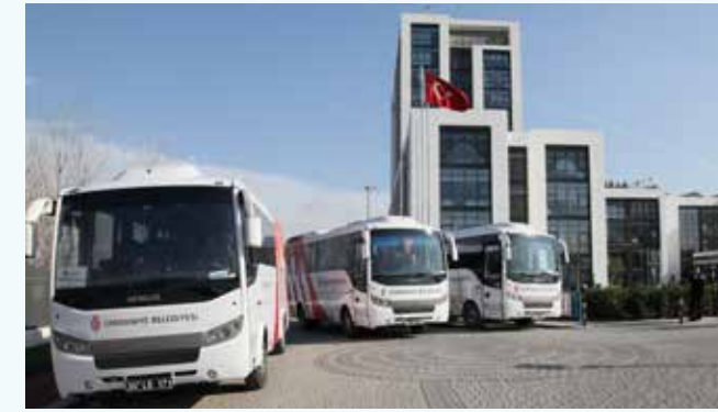
» Personel Servis Hizmeti

Çalışan memnuniyeti ve gecikmelerden kaynaklanabilecek her türlü iş aksamalarının önüne geçmek amacıyla 389 personelimizin yararlandığı ve 14 ayrı güzergahta sunulan servis hizmeti Müdürlüğümüz tarafından yürütülmektedir.