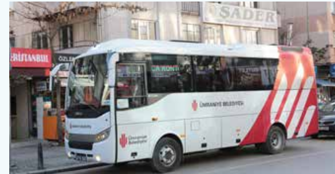
» Dernek ve Vakıflara Araç Desteği - SADER

Kâr amacı gütmeyen çeşitli hemşeri dernekleri ve vakıflarımızın kültürel ve sosyal amaçlı faaliyetlerine 2013 yılında 182 adet/sefer araç görevlendirilmiştir.