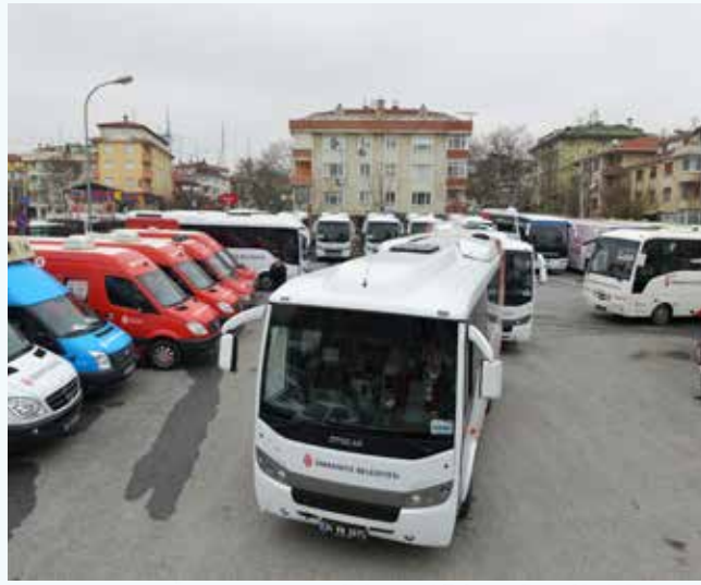
» Tantavi Garajımızdaki Hizmet Araçlarından Görünüm

Müdürlüklerimiz için çeşitli iş ve işlemlerini yürütmek amacıyla 2013 döneminde toplam 21.950 adet/sefer görevlendirme yapılmıştır.