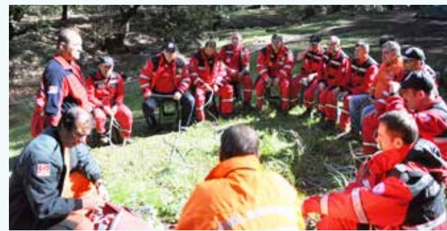
» Arama Kurtarma Ekibi Dağcılık Eğitimi

Ülkemizin her köşesindeki afetlerde bilgi ve deneyime dayalı, profesyonel müdahale kabiliyeti yüksek ve her an her türlü koşulda sorumluluk almaya hazırlıklı olan Arama Kurtarma Ekibimizin teknik eğitimleri 2013 yılı içinde de devam etmiş, bu kapsamda Arama Kurtarma Ekibimiz, 8-12 Nisan tarihleri arasında İzmir Kemalpaşa Dereköy Mevkisinde 5 günlük dağcılık eğitimine katılmıştır.