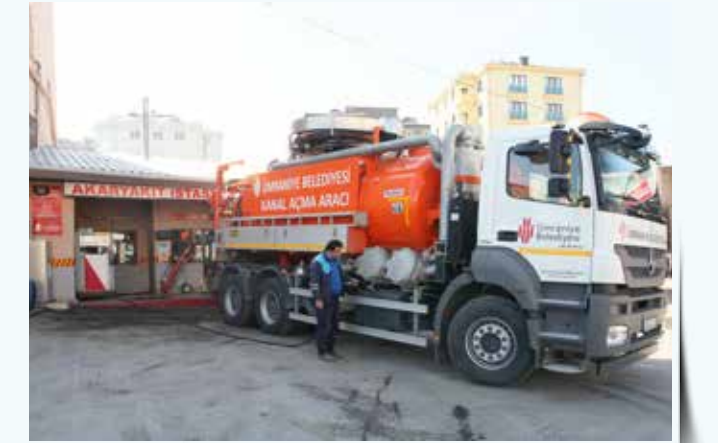
» Akaryakıt Dağıtımı