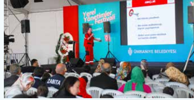
» Yerel Yönetimler Bayramında Afet Bilinci Eğitim

Yaşanan deneyimler ve bilim adamlarının önerileri göstermektedir ki; özellikle deprem konusunda önceden alınacak basit tedbirler ve sarsıntı anında gösterilecek doğru davranışlar ile depremin yıkıcı etkileri önemli ölçüde azaltılabilmektedir.