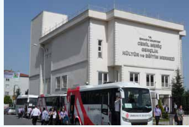
» Sosyal ve Kültürel Faaliyetlere Destek

Bu kapsamda 2013 yılında Belediye birimlerimizin sosyal ve kültürel aktiviteleri için 1.035 adet/sefer; vatandaşımıza ve kâr amacı gütmeyen çeşitli kurumlara destek amacıyla ise toplamda 6.008 adet/sefer araç görevlendirilmiştir.