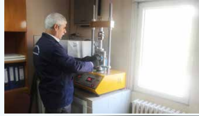
» Kalite Ölçümleri Asfalt Laboratuvarımızda Yapılmaktadır

Asfalt Kalite Laboratuvarımızda gerekli ölçüm ve deneyler aksatılmadan yapılarak asfalt üretim kalitesi maksimumda tutulmuştur.