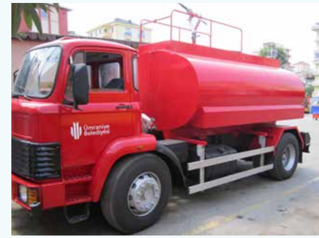
» Revize Edilen Su Tankerimiz

Araç ve iş makinelerimizin kaynak işleri, egzoz tamir işleri, iş makinelerimizin bıçak ve tırnaklarının değişimi, Belediye Başkanlık binası ve tüm birimlerin oksijente kesim ve kaynak işleri de kademe birimlerimiz tarafından yapılmaktadır.