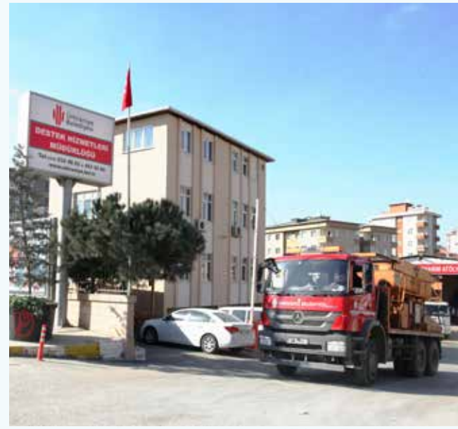
» Araç Sevk ve İdaresi

Belediyemizin yapmış olduğu altyapı, asfalt, hafriyat, afiş asma, yıkım ve kazı gibi tüm teknik çalışmalarda iş makinelerimiz başta olmak üzere tüm diğer araçlarımız ile 7 gün 24 saat kesintisiz lojistik destek sağlamıştır.