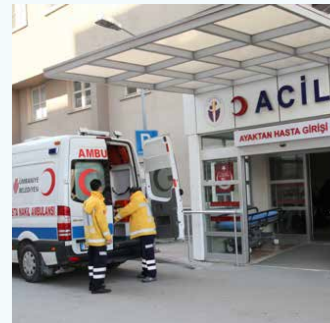
» Ambulans ile Hasta Nakli Ümraniye Devlet Hastanesi

Ulaşım imkânları yetersiz olan yatalak hastalar Belediyemize müracaatları ile tam donanımlı hasta nakil ambulansıyla evlerinden alınarak sağlık kuruluşuna ulaştırılmakta ve işlemleri tamamlandıktan sonra evine geri götürülmektedir. Bu kapsamda kayıtlı hastalarımız için 2.029 adet/sefer ambulans ile hasta nakil hizmeti gerçekleştirilmiştir.