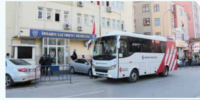
» Resmi Kurumlara Araç Desteği - İlçe Emniyet Müdürlüğü

Ayrıca yıl içinde, İlçe Kaymakamlığına 2, Emniyet Müdürlüğüne 17, İstanbul Anadolu Adalet Sarayına 1, İlçe Seçim Kuruluna 1, İlçe Müftülüğüne 1, İlçe Spor Müdürlüğüne 1 ve Ümraniye İŞKUR Hizmet Merkezine de 1 adet olmak üzere toplam 24 adet binek araç tahsis edilmiştir.