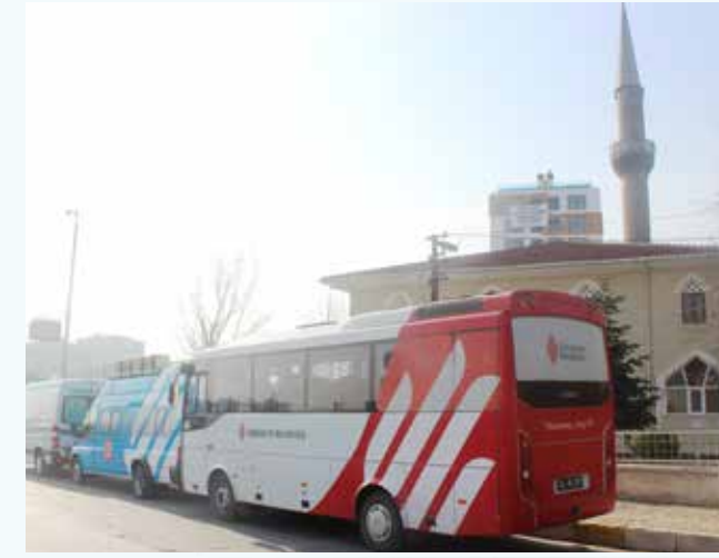
» Cenaze Nakil Hizmetimiz - Rahmet Camii

Sosyal belediyecilik faaliyetlerimizin önemli bir ayağını oluşturan cenaze hizmetlerimize 2013 yılında da devam edilmiş; bu kapsamda ilçemizde yaşayan vatandaşlarımızın cenaze merasimleri için il içi ve il dışı toplamı olarak 1.550 adet/sefer otobüs görevlendirilmiştir.