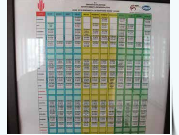
» Araç ve İş Makinesi Bakım Takvimi

Araç ve iş makinelerimizin tamamını kapsayan koruyucu ve önleyici bakım çalışmalarımız, toplamda 484 defa gerçekleştirilmiştir. Böylelikle muhtemel arızalar önlenmiş, iş ve zaman kayıplarının önüne geçilerek işletme maliyetlerimiz minimum düzeyde kalırken günlük faal araç oranımızın yüksek bir oranda gerçekleşmesi sağlanmıştır.