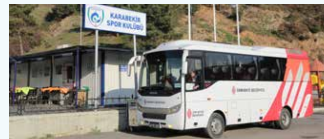
» Amatör Spor Kulüplerine Araç Desteği - Karabekir Spor

5393 sayılı Belediye Kanunu'nun 14. maddesinin "b" bendinde belirtilen "amatör spor kulüplerine aynı ve nakdi yardım yapar ve gerekli desteği sağlar." hükmü uyarınca; ilçemizde bulunan amatör kulüplerimizin il içi ve il dışı idman ve müsabakalarına ulaşmalarının sağlanması için 2013 yılında 480 adet/sefer araç görevlendirmesi yapılarak destek sağlanmıştır.