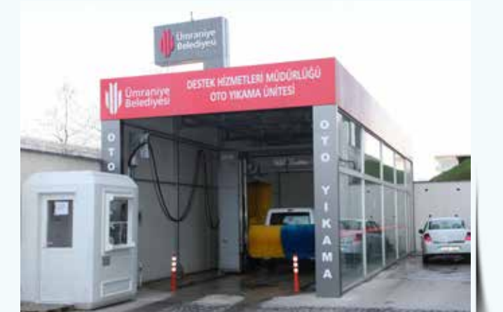
» Araç Yıkama Ünitesi

Söz konusu üniteye faaliyete geçtiği Temmuz ayından itibaren 4.763 kez yıkama işlemi gerçekleştirilmiştir.