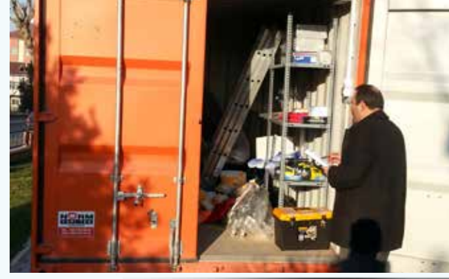
» Afet İstasyonu Periyodik Kontrolü

Söz konusu AFİS'ler bulunduğu yerde her iki ayda bir periyodik olarak titizlikle kontrol edilmekte ve oluşabilecek eksiklikler zamanında giderilerek olağanüstü koşullara hazırlık düzeyleri yüksek tutulmaktadır. Bu çerçevede yapılan düzenli kontrol sayısı 180 defa gerçekleşmiştir.