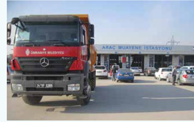
» Araç Muayene Çalışmalarımız

İhale yoluyla alımı yapılan 25 adet aracımızın ruhsat ve trafik sicil kayıtları gerçekleştirilmiş; sigorta süresi 2013 yılı içinde dolan 176 adet aracımız için işlem yenilemesi yapılmıştır. 150 adet aracın fenni muayenesi de 2013 yılı içinde gerçekleştirilmiştir.