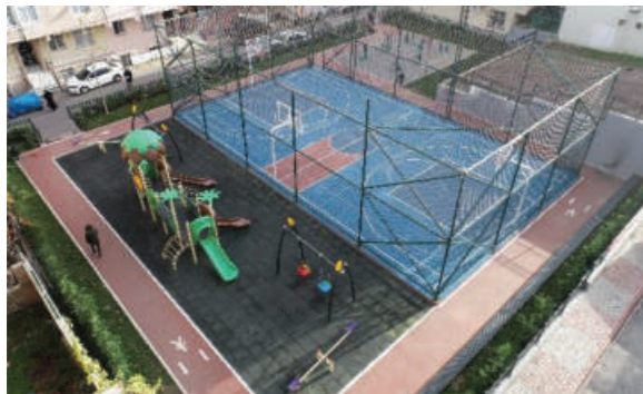
Esenşehir Mahallesi Zambak Parkı

İlçede yeşil alan ve rekreasyon alanı miktarını artırmak ve mevcut yeşil alanların bakım onarımını yaparak korunmasını sağlamak.