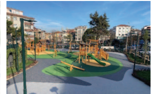
Mevlana Parkı Revizyonu