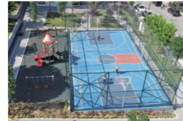
Karacaoğlan Parkı Revizyonu