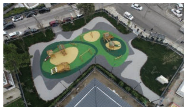
Atatürk Mahallesi Mevlana Parkı