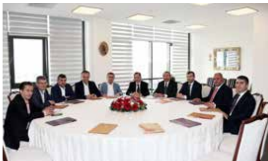
» Anadolu Yakası Belediye Başkanları Koordinasyon Toplantısı

Belediyemizin birinci derecede karar organı olan meclis toplantılarımızın verimli bir şekilde yapılması için gerekli koordinasyon ve hazırlıklar yapılmıştır. Ayrıca belediyemizin doğal paydaşlarından olan muhtarlarımızla mahallelerinde bulunan sorunlarla alakalı istişare toplantıları yapılmıştır.