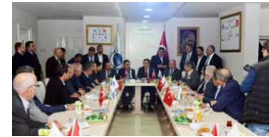
» Sayın Başkanımızın Bingöl Kişi Sanayici ve İşadamları Derneği (KİSİAD) Ziyareti

Özellikle hemşehri dernekleri, göç yoluyla ilçemize gelmiş vatandaşlarımızın kente adaptasyonu konusunda önemli bir görevi üstlenmelerinden dolayı belediyemizin doğal paydaşı olarak kabul edilmektedir.