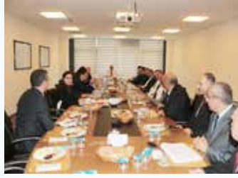
» Muhtarlarımızla İstişare Toplantılarından

Belediyemizde iş ve işlemlerin düzenli ve sorunsuz bir şekilde yürütülmesi için kurum içi belli bir toplantı sistematığı oluşturulmuştur. Bunlar;