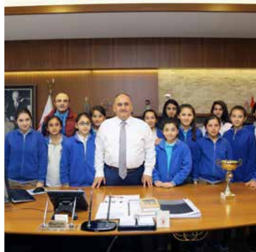
» Yavuz Selim Orta Okulu ve Kız Futbol Takımı'nın Ziyareti

Başkanımızın haftalık olarak düzenlenen programlarını aksatmadan uygulanması için azami gayret ve titizlik gösterilmiştir. Başkanlık makamına gerek yazılı, gerek sözlü ve gerekse elektronik posta yoluyla yapılan istek ve şikâyetler titizlikle incelenip gerekli