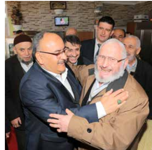
» Sayın Başkanımızın Esnaf Ziyareti

Ayrıca Başkanımız belirli zamanlarda, ilçemizde farklı sektörlerde faaliyet gösteren esnaflarımızı ziyaret etmekte ve esnaflarımızın talep ve şikâyetleri değerlendirilmektedir.