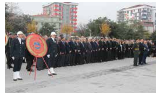
» 10 Kasım Bayrak Töreni

Dini bayramlarda vatandaşlarımızla bayramlaşmalar düzenlenmiş, başkanımız binlerce Ümraniyeliyle bir araya gelmiştir. Çeşitli ikramlar, çocuklarımıza hediyeler, ihtiyaç sahiplerine yapılan yardımlarla renklendirilen bu organizasyonlarla bayram coşkusunun toplumumuzun her kesiminde doyasıya yaşanması için çalışılmıştır.