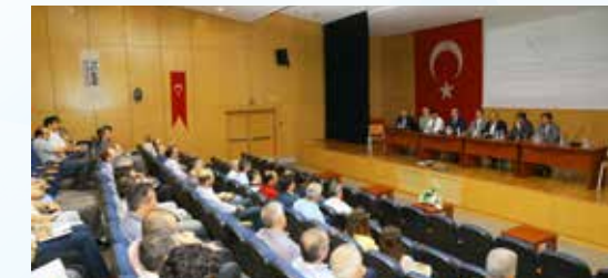
» 14.09.2015 İlçe Milli Eğitim Müdürlüğü Toplantısı

Ümraniye Belediyesinin başkanımızın önderliğinde yaptığı başarılı çalışmaları birçok kesimin ilgisini çekmeye devam etmektedir. Bu sebepten birçok kurum ve kuruluş başarı öykümüzü dinlemek için başkanımıza davette bulunmaktadır. Sayın Başkanımız gelen davetlerden programına uygun olanlara katılarak belediyeçilik ile ilgili konularda sunumlar yapmıştır.