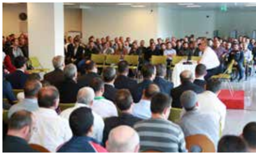
» Başkanımızın Belediye Personelimiz ile Toplantısı