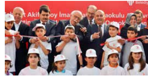
» Mehmet Akif İmam Hatip Ortaokulu Açılışı