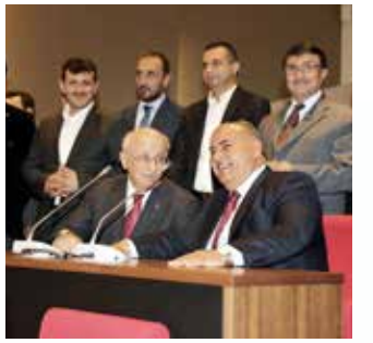
» Meclis Başkanımız Sayın İsmail Kahraman'ın Ziyareti

Başkanımızdan randevu talep eden kurum ve kuruluş temsilcilerinin bizzat görüşmeleri sağlanmıştır.