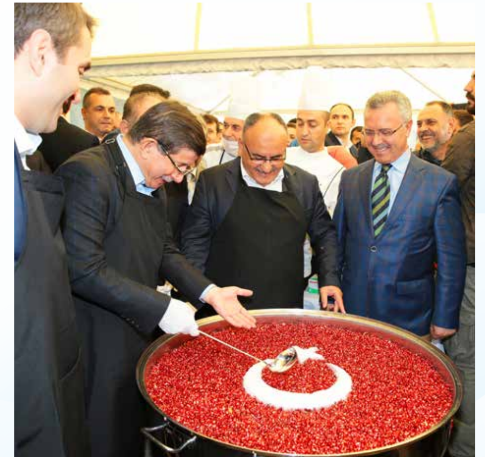
» Sayın Başbakanımız Ahmet Davutoğlu'nun katılımı ile Aşure dağıtımı

Başkanımızdan randevu talep eden kurum ve kuruluş temsilcilerinin bizzat görüşmeleri sağlanmıştır.