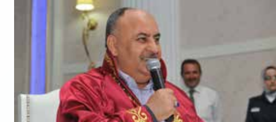
» Sayın Başkanımız nikah ve düğün törenlerine katılım gösterdi.

Vatandaşlarımız tarafından bizzat başkanımıza ya da müdürlüğümüze ulaştırılan dış mekan nikah ve düğün davetleri titizlikle takip edilmiş ve katılım sağlanmıştır. Başkanımız veya başkanlık makamı tarafından görevlendirilen başkan yardımcılarımız davetlere icabet ederek çiftlerimizin ve yakınlarının mutlu günlerinde yanlarında olmuşturlardır.