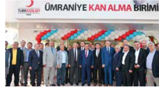
» Türk Kızılayı Ümraniye Şubesi Açılışı