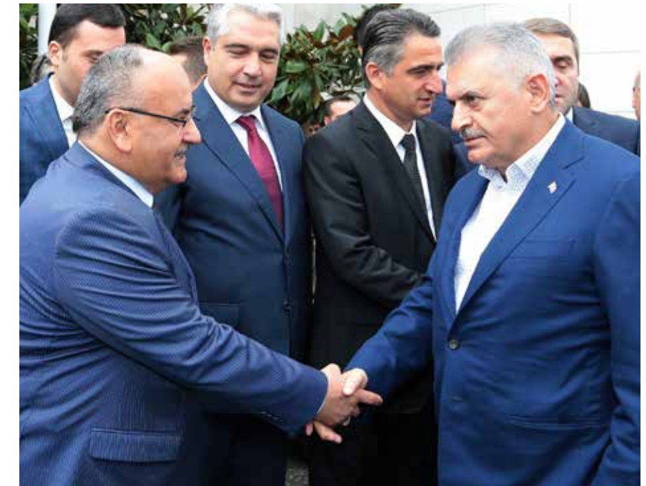
» Başbakanımız Sayın Binali YILDIRIM'ın Ümraniye'mizi Ziyareti