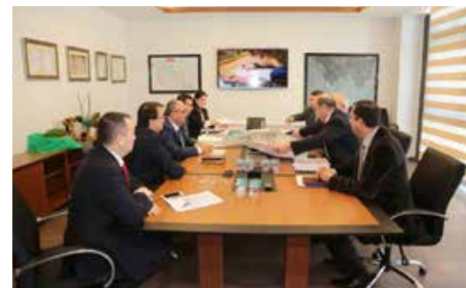
» İski Genel Müdürü ve Yetkilileriyle Toplantı

Çözüm odaklı hizmet anlayışıyla yola devam eden Ümraniye Belediyesi ilçemizi ilgilendiren tüm sorunların çözümü ile ilgili diğer kamu kurum ve kuruluşlarıyla sıkı temas halindedir. Bu anlamda İSKİ, İGDAŞ ve İSFALT gibi kurumlarla yıl içinde birçok toplantı programı tertip ettik.