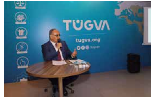
» Tugva Söyleşi Programı

Ümraniye Belediyesinin başkanımızın önderliğinde yaptığı başarılı çalışmaları birçok kesimin ve kurumun ilgisini çekmeye devam etmektedir. Bu sebepten birçok kurum ve kuruluş başarı öykümüzü dinlemek için başkanımıza davette bulunmaktadır. Sayın Başkanımız biriktirmiş olduğu başarı dolu yılları, gelişen Türkiye'mize bir tuğla daha koymak adına tam bir içtenlikle diğer kurum ve kuruluşlara aktarmıştır.