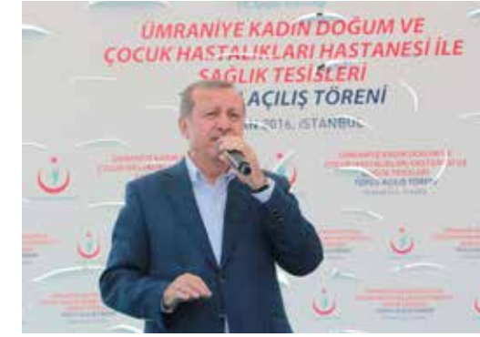
» Cumhurbaşkanımız Sayın Recep Tayyip ERDOĞAN'ın teşrifleriyle açtığımız Ümraniye Kadın Doğum ve Çocuk Hastalıkları Hastanemizin açılışı

Tüm hemşhailerimizin eşit hizmet alması, her kesimin Ümraniyeli olmanın gururunu taşıması için birçok çalışma, organizasyon ve tören düzenlenmiştir. İstanbul'u hızla saran metro ağlarının artık Ümraniye'miz ile buluşmasında son aşamaya gelmiştir. Birçok organizasyona ev sahipliği yaptığımız gibi vatandaşlarımızın en mutlu günlerinde yanlarında olmak adına birçok program, açılış, nikah ve düğün programlarında başkanımızın katılımıyla bir araya gelinmiştir.