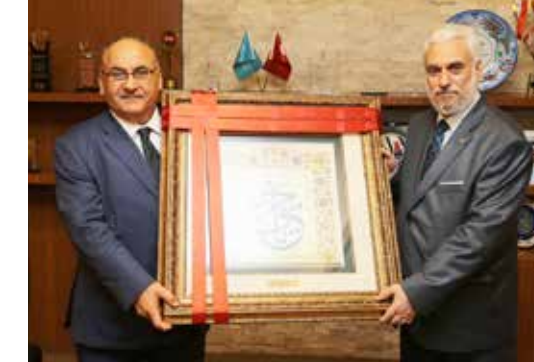
» Bulgaristan Başmüftüsü Sayın Mustafa ALIŞ'in Sayın Başkanımızı Ziyareti

Başkanımıza yapılan ziyaretlere cevaben muhtelif kuruluşlarımıza iade-i ziyaretler programlanarak gerçekleştirilmiştir.