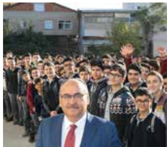
» Ümraniye Anadolu İmam Hatip Lisesi Bayrak Töreni

7/24 hizmet ilkesiyle, halkımızın Belediyemizle olan iletişiminde memnuniyet derecesinin üst düzeyde olmasını sağlamak hedeflenmiştir.