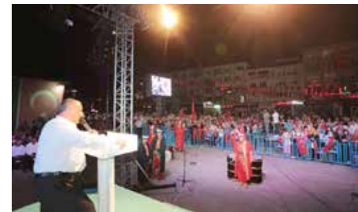
» 15 Temmuz Şehitler Meydanı Nöbetimiz

Ayrıca cenaze sahibi vatandaşlarımızın sıkıntı çekmemeleri için taziye evlerine sıcak yemek servisi yapılmış ve cenazeye katılacakların ulaşımı konusunda otobüsler temin edilmiştir. Ayrıca periyodik zaman aralıklarında, ilçemizin çeşitli camilerinde sabah namazının ardından vatandaşlarımızla Başkanımızın hasbihal edebileceği ortamlar oluşturuyoruz.