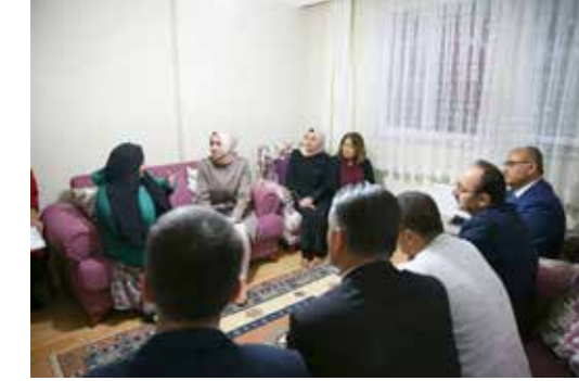
» Aile ve Sosyal Politikalar Bakanı Sayın Fatma Betül SAYAN KAYA'nın katılımıyla şehit ailemizi ziyaret programı