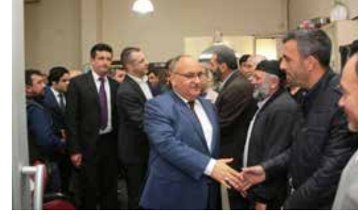
» Sayın Başkanımızın Gümüşhane Kayadibi Köyü Derneğini Ziyareti

Ümraniye'miz hemşehri dernekleri, vakıflar ve STK ların yerleşkeleri bakımından oldukça zengin bir yapıya sahiptir. Başkanımız ilçemizde bulunan bu kurum ve kuruluşlarımızın yöneticilerinin ve üyelerinin sorunlarıyla yakından ilgilenmiştir.