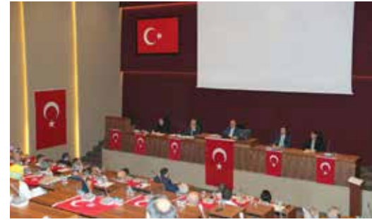
» 15 Temmuz darbe girişimi sonrası Belediye Meclisimiz Ortak Deklarasyonu Oturumu

Belediyemizin birinci derecede karar organı olan meclis toplantılarımızın verimli bir şekilde yapılması için gerekli koordinasyon ve hazırlıklar yapılmıştır. Ayrıca belediyemizin doğal paydaşları arasında yer alan muhtarlarımızla mahallelerdeki sorunlarla ilgili yoğun istişare toplantıları yapılmıştır.