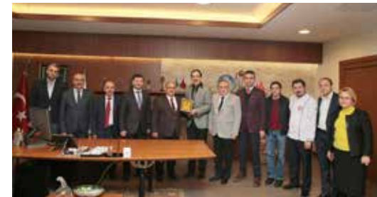
» Bolu Belediye Başkanı Alaaddin YILMAZ ve Bolulu hemşehrilerimizin Başkanımızı Ziyareti

Bununla birlikte başkanımız belirli zamanlarda ilçemizde farklı farklı sektörlerde faaliyet gösteren esnafımızı ve sivil toplum kuruluşlarını ziyaret ederek talep ve şikâyetlerini değerlendirmiştir.