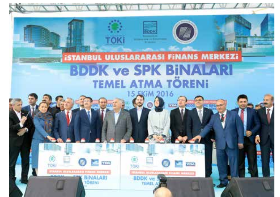
» Başbakanımız Sayın Binali YILDIRIM'ın teşrifleriyle Ümraniye'mizde temeli atılan Uluslararası Finans Merkezi Temel Atma Töreni

İlçeye kazandırılan yeni kalıcı eserlerin açılış törenleri ve kazandırılacak birçok yapının temel atma törenleri, Başkanımızın katılımlarıyla gerçekleşti.