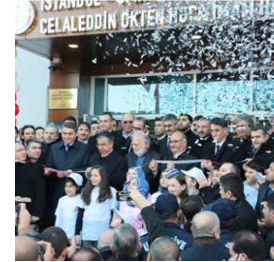
» Milli Eğitim Bakanımız Sayın İsmet YILMAZ Bey'in katılımıyla açılan Celalettin Ökten Hoca İmam Hatip Ortaokulu

Ümraniye Belediyesi, altyapı ve üstyapıda yeni yatırımlar, kültürel ve sosyal içerikli birçok projenin temel atma ve açılış törenlerini gerçekleştirdi. Başkanımız bu törenlerin tamamına iştirak ederek ve bizzat organize ederek halkımızın sevincini paylaşmış ve onlarla bir araya gelmiştir.