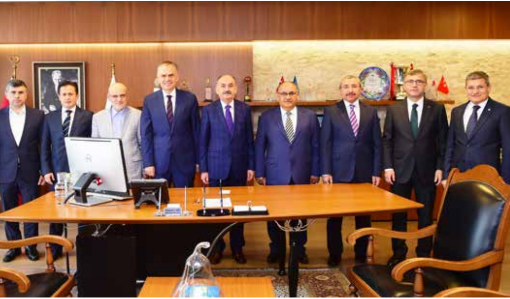
» Bakanımız Sayın Dr. Mehmet MÜEZZİNOĞLU ve Anadolu Yakası Belediye Başkanlarının Belediyemizi Ziyareti