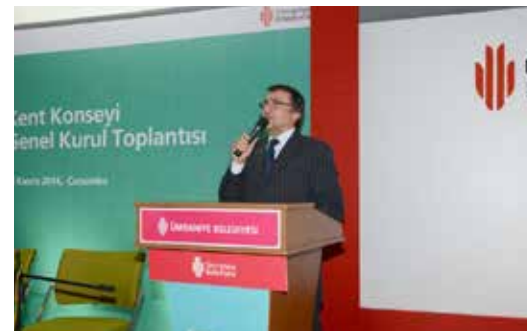
» Kent Konseyi Genel Kurulu