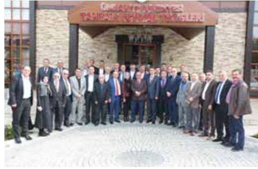
» Muhtarlar Günü Toplantı Programı

Belediyemizdeki iş ve işlemlerin düzenli ve sorunsuz bir şekilde yürütülmesi için kurum içi belirli bir toplantı sistematigi oluşturulmuş, aksatılmadan ve sorunsuz bir şekilde uygulanmaktadır.