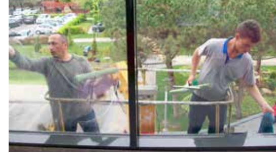
Dış Mekan Temizliği

Ana hizmet binasının toplam 6550 m 2 olan tüm dış cephe camlarının düzenli olarak silinmesi sağlanmıştır.