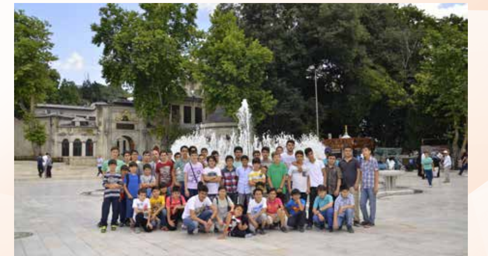
» İstanbul Gezileri

2015 Yılında İstanbul'un farklı mekânlarına kültürel geziler düzenlenmiştir. Bu geziler vasıtasıyla İstanbul içinde tarihi ve kutsal mekanlara gitmek isteyenler için önemli bir hizmet gerçekleştirilmiştir. Bu hizmet kapsamında ile 2.700 vatandaşımız gezilerden faydalanmıştır.