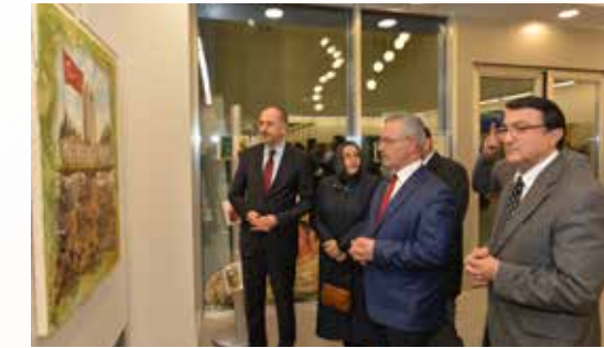
» Sergide; Resimler ve Çanakkale ile ilgili materyaller sergilenildi.

Ümraniye Belediyesi olarak Çanakkale'ye yönelik sergi ve programlarımızı hem ulusal hem de uluslararası platformlara taşıyarak, Çanakkale zaferinin anlam ve önemine kuvvetli bir vurgu yapmayı 2015 yılı boyunca önemli bir görev ve hedef olarak belirledik. Bu kapsamda Kültür ve Turizm Bakanlığı ile ortak bir projeye imza attık. Ankara Devlet Güzel Sanatlar Galerisi Müdürlüğü bünyesinde açılan Hasan Rıza Sergi Salonunun açılışını Ümraniye Belediyesinin Çanakkale konusunu ele alan 10. ve 11. Resim Yarışması'nda dereceye giren eserlerden ve Çanakkale ile ilgili materyallerden oluşan sergi ile gerçekleştirdik. Açılışa sanat ve siyaset alanından bir çok önemli insan katıldı.