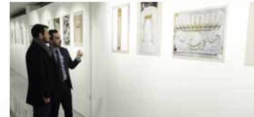
» Taşa İşlenen Medeniyet Fotoğraf Sergisi