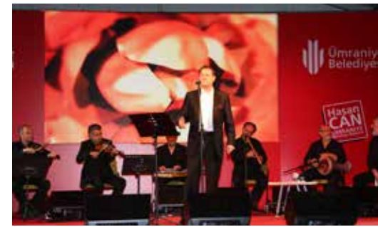
» Ahmet Özhan Konseri