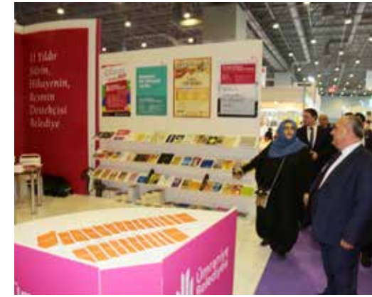
» CNR Expo Kitap Fuarı

Ümraniye Belediyesi, ana teması 100. Yılında Çanakkale olan CNR Kitap Fuarında katılımcı olarak yer almıştır. CNR Kitap fuarında dereceye giren yarışma yayınları, sempozyum ve kongre bildirilerinden oluşan özel telif eserler, sergi amacıyla raflarda yer almıştır. Yayınlarımızı okuyucularla bir araya getirmek amacıyla kurulan stant, Belediyemizin kültür ve sanat faaliyetlerini vatandaşlara tanıtmayı hedeflemiştir. Ziyaretçilerin, birçoğu proje olarak gerçekleşen kitapları ve katalogları ve özel çalışmaları görme ve tanıma imkânları buldular. Ayrıca fuar alanında dereceye giren Çanakkale resimleri sergilenmiş, Çanakkale çizgi filmi ekranlara taşınmıştır.