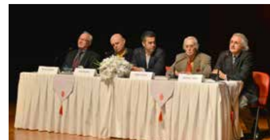
» Tarık Buğra Anma Programı