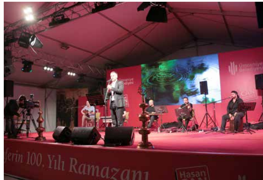
» Ramazan Programları-Zeyd Şoto

Osmanlı Dönemi'nin önemli Ramazan Geleneği olan 'Temcid Salası' Ümraniye'de yeniden hayat buldu.