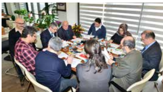
» 11. Geleneksel Yarışmalar Jüri Toplantısı