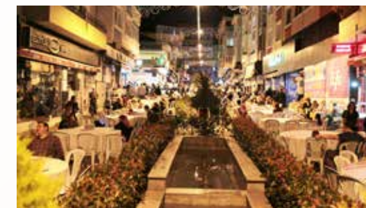
» Sahur Programı-Çiftlik Sokak

Ümraniye Belediyesi, Ümraniye'li hemşerilerimizle birlikte sahur yapmak ve Müslüman vicdanın kanayan yarası Srebrenitsa'yı anmak amacıyla, Ümraniye Çiftlik Sokak'ta sahur programı düzenledi. Yaklaşık 4 bin kişinin katıldığı sahur programında, Srebrenitsa şehitleri dualarla anıldı.