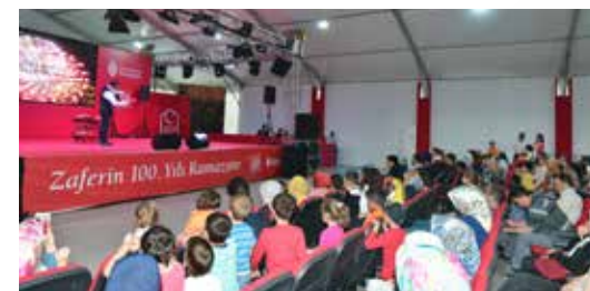
» Ramazan Ayı Etkinlikleri