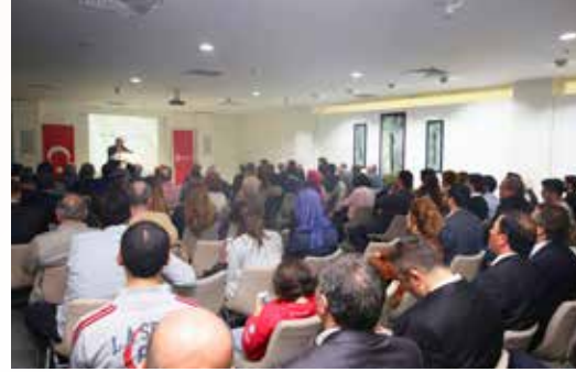
» 2015 Kültür Sanat Yılı Açılışı