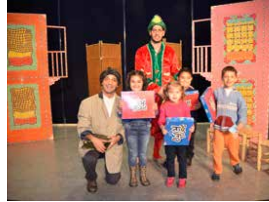
» Çocuk Tiyatro Oyunu

2015 yılında gerçekleştirilen 10 yetişkin tiyatrosu ile de 821 kişiye ulaşılmıştır. Yetişkin tiyatroları vasıtasıyla çeşitli toplumsal meselelerin yanı sıra tarihsel süreç içerisinde önemli olayları ele alan tiyatro oyunları sahnelenmiştir. Bu çerçevede "28 Şubat", "72 Gün Son Kale Medine", "İnsan Ne İle Yaşar" "Kayıp Emanet" gibi tiyatro oyunları sergilenmiştir.