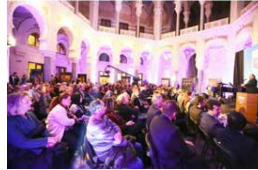
» Çanakkale'ye Dair Ağıtlardan oluşan bir konser verildi.

Çanakkale ruhunun Türkiye sınırlarını aşan boyutunu gözler önüne sermek isteyen Ümraniye Belediyesi, 18 Mart Çanakkale Zaferi'ni ve bu savaşta 3000 şehit veren Saraybosna'nın Çanakkale şehitlerini anmak üzere Bosna-Hersek'in Başkenti Saraybosna'da büyük bir etkinlikte gerçekleştirdi. 2. Dünya Savaşının başlamasına neden olan Avusturya- Macaristan İmparatorluğu veli-ahtına suikast olayının vuku bulduğu şehir olan ve bu anlamda Çanakkale zaferiyle de dolaylı bağlantısı bulunan Başkent Saraybosna'da düzenlenen "100. Yılında Çanakkale Zaferi" adlı sergiye katılım oldukça yoğundu. Bu kapsamda konu 100. Yılında Çanakkale Zaferi olarak belirlenen 11. Geleneksel Resim Yarışması'nda dereceye giren eserlerden oluşan bir sergiyi Bosna Hersek'in başkenti Saraybosna'da açtı. Etkinlik, ünlü Tenor Hakan Aysev ve Piyanist Anjelika Akbar'ın Çanakkale'ye dair ağıtlardan oluşan repertuarla verdikleri konserle devam etti.