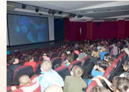
» Yarıyıl Özel Programları

Öğrencilerin yoğun katılımının yaşandığı Yarıyıl Özel Programında 112 etkinlik gerçekleştirilmiş ve bu etkinliklere 18.664 öğrenci katılmıştır.