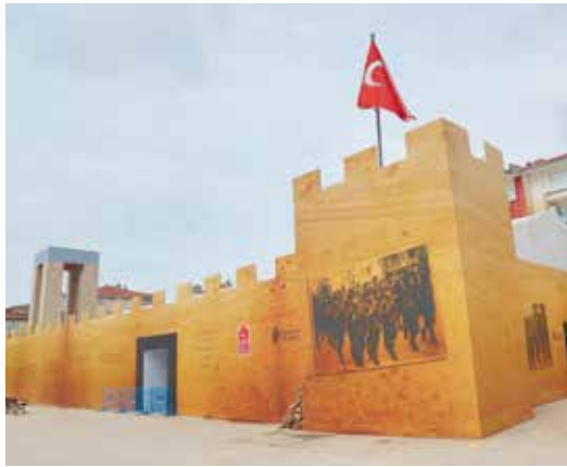
» Ümraniye Meydanı

Ümraniye Belediyesi olarak 2004 yılından bu yana Ramazan ayına yönelik, Ramazan ayının ruhuna uygun etkinlikler düzenlemekteyiz. Ümraniye'nin her kesimini içine alan, birlik ve beraberlik ruhunu geliştiren, insanların aynı amaçlar doğrultusunda bir araya gelmesi ve dayanışma içerisinde Ramazan ayının manevi atmosferi altında bir ay geçirmesi amacıyla birçok etkinlik düzenlenmiştir.