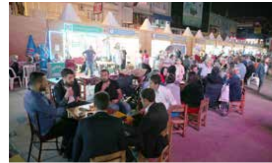
» Ümraniye Meydanı/ Dernek Vakıf Standları