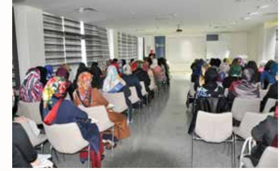
» Akademi Nisa-Sümeyye Erdoğan'ın katılımı ile