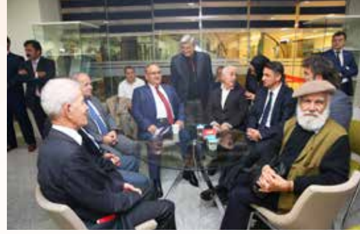
» 2015 Kültür Sanat Yılı Açılış Programı