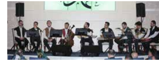
» Kutlu Doğum Programı

"Âlemlere rahmet" olan Sevgili Peygamberimizin dünyayı şereflendirmesinin dünya ve insanlık tarihindeki yerini ve önemini kavrayabilmek için O'nun doğduğu zamanda yaşanan sosyal hayatı ve O'nun risaleti sonrası oluşan sosyal hayatı karşılaştırmalı olarak incelemek gerekir. Bu münasebetle, Ümraniye Belediyesi ve Ümraniye Müftülüğü, kutlu doğum etkinlikleri çerçevesinde Peygamberimizi daha iyi anlayabilmek, insanlarımızın gündemine Peygamber Efendimizi taşıyabilmek için bu anlamda etkinlikler düzenlenmektedir.