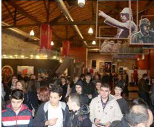
» 100. Yılında Çanakkale Resim Sergisi

2015 yılında 100. Yılıni yaşadığımız, metre-kareye 6 bin merminin düştüğü, yaşlısından gencine fedakâr insanlarımızın ülkemiz için gözünü kırpmadan şehit düştüğü, Çanakkale Savaşının önemine dikkat çekmek, milli şuurun oluşmasına katkı sağlamak adına Ümraniye Belediyesi olarak uluslararası düzeyde resim sergisi organize etmiş bulunmaktayız. Bu kapsamda 100. Yılında Çanakkale zaferi temalı resim sergimiz, Dolmabahçe sanat galerisinde vatandaşlarla buluştu. Sergide yer alan resimler Ümraniye Belediyesi 11. Geleneksel Resim Yarışmasında dereceye girmiş eserler olup sergi kapsamında, savaşta kullanılan süngüler, silahlar, askeri malzemelerden, kişisel eşyalara kadar birçok objeye ve belgeye yer verilmiştir. Sergi dokuz gün boyunca açık kalmıştır.