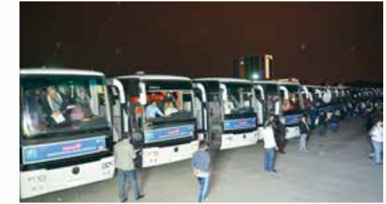
» Çanakkale Gezi Araçları