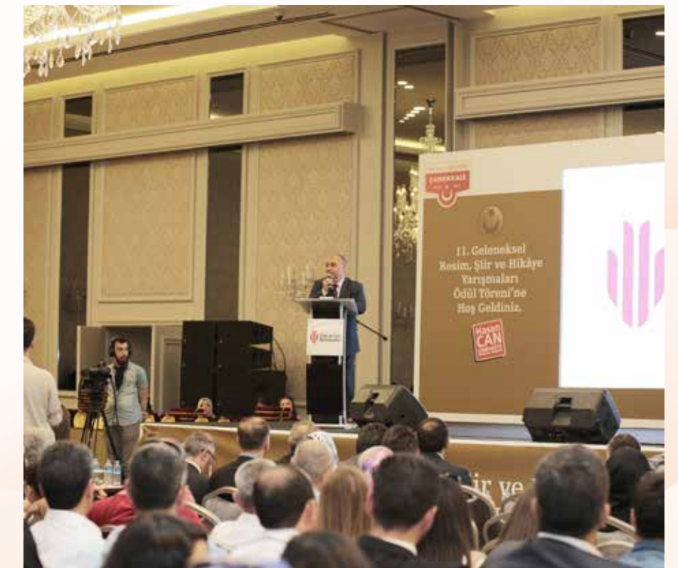
» Resim, Hikâye ve Şiir Yarışmaları Ödül Töreni

Konusu "100. Yılında Çanakkale Zaferi" olarak belirlenen yarışmaların sonunda İstanbul Crowne Plaza'da düzenlenen bir program ile dereceye girenlere ödülleri takdim edildi. Çevre ve Şehircilik Bakanı İdris Güllüce'nin onur konuğu olduğu programda, dereceye giren ve sergilenmeye değer görülen resimlerden oluşan serginin de açılışı yapıldı.