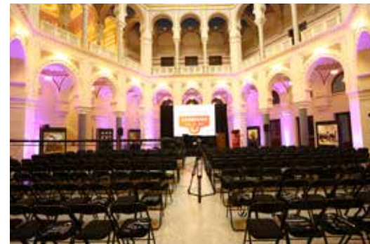
» Bosna Hersek