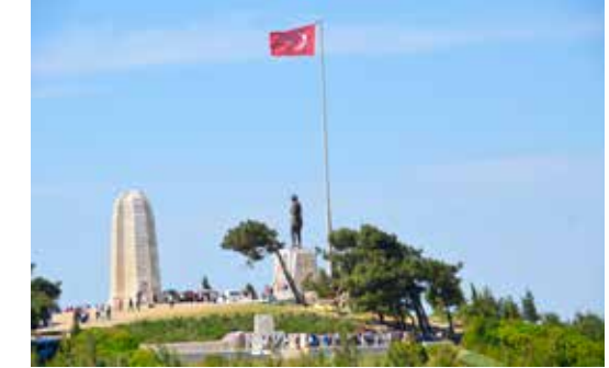
» Çanakkale Kültür Gezileri

dü. Katılımcılara sabah ve öğle olmak üzere 2 öğün yemek dağıtıldı. 100 yıl önce büyük bir mücadelenin yaşandığı, savaşın hala izlerini ve ruhunu taşıyan toprakları görmek ve o kokuyu teneffüs etmek, milli bilinç ve şuurunu canlandırmak açısından büyük bir öneme sahip olmakla beraber, kutsal bir amaca hizmet etmektedir.