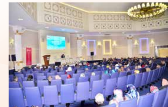
» Çanakkale Şehitleri İçin Düzenlenen Program-Nikah Sarayı

Ümraniye Belediyesi ve Ümraniye Müftülüğü'nün ortaklaşa düzenlediği "Çanakkale Şehitleri İçin Hatim Duası ve Kur'an-ı Kerim Ziyafeti" programı Nikâh Sarayı'nda gerçekleştirildi.