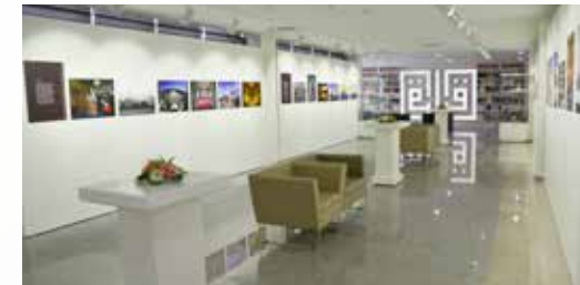
» "Sen İstanbul Olsaydın Keşke" konulu sergi

Çanakkale Zaferinin 100. Yılı olması sebebiyle Geleneksel Resim yarışmamızın konusu da "100. Yılında Çanakkale" olarak belirlendi. Bu amaçlardan yola çıkarak yarışmada dereceye giren eserler, Bosna-Hersek, Dolmabahçe Sanat Galerisi, Ümraniye Meydan, Ankara Hasan Rıza Sergi Salonu, Crown plaza, Ümraniye Kültür ve Sanat Merkezi, CNR Expo gibi birçok farklı alanda ve etkinlikte sergilendi. Ayrıca "Özgün hat sergisi", "Taşa İşlenen Medeniyet Sergisi", Ebru'larda "Elif" sergisi, "Sen İstanbul Olsaydın Keşke" adlı resim sergisi gibi farklı sanat alanını içine alan birbirinden değerli eserler, sanatçıların katıldığı söyleşi programı ile sanatseverlerle buluştu, ayrıca bu sergilerin katalogları da basılarak sanat dünyasına kazandırıldı. 2015 yılı içerisinde gerçekleştirilen 9 sergi etkinliği 18.250 kişi tarafından gezilmiştir.