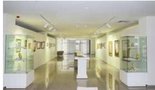
» Ümraniye Kültür ve Sanat Merkezi

Ümraniye Belediyesi, belediye hizmet binasının girişinde yer alan ve dikkat çekici bir tasarıma sahip “Ümraniye Kültür ve Sanat Merkezi”ni sanatseverlerin hizmetine sundu. İlçedeki sanatseverleri buluşturan ve birçok sanat dalının icra edilmesine ev sahipliği yapan merkez vatandaşın da yoğun ilgi görüyor. Sergi açılış ve etkinliklerinden konferansa, şiir dinletilerinden eğitim faaliyetlerine kadar birçok etkinliğin icra edildiği merkez Ümraniyeli sanatseverlerin uğrak alanı haline geldi.