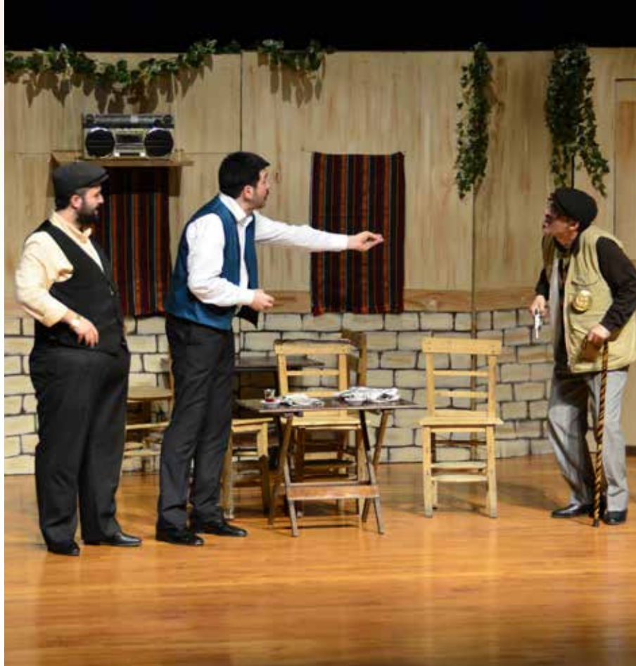
» "Kayıp Emanet" adlı Yetişkin Oyunu

» Ulusal ve uluslararası platformlardaki sergilerimiz ile sanatçılar ve sanatseverler ortak bir noktada buluşturuldu.