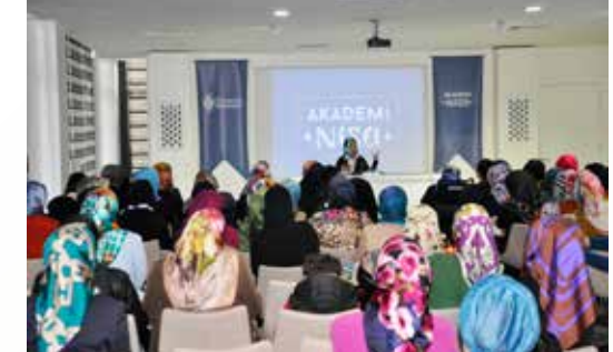
» Belçika Milletvekili Mahinur Özdemir'in katılımı ile