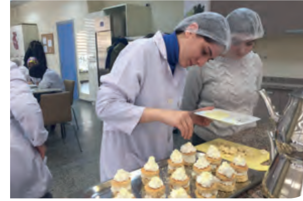
Aşçı Yardımcılığı kursu

Dikiş, aşçı yardımcılığı, kuaförlük, bilgisayar, çocuk bakıcılığı, hediyelik eşya hazırlama, özel bakım elemanı branşlarında haftanın beş günü eğitim verilmektedir. Eğitime katılan öğrencilere İşkur tarafından günlük 25 tl ödeme yapılmaktadır.