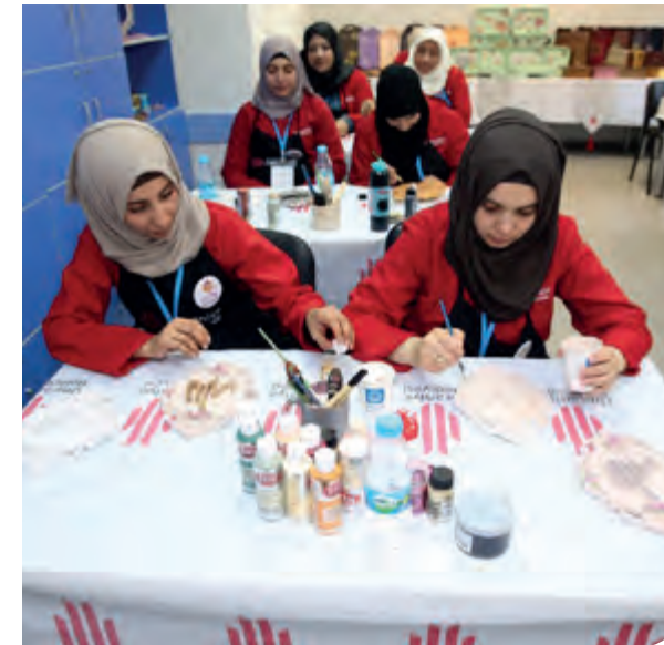
Hediyelik eşya hazırlama kursu

Eğitimler Suriyelilerin yoğun olarak yaşadığı mahallelerde bulunan kültür merkezlerinde 103 Suriyeli, 137 Ümraniyeli kadın olmak üzere toplamda 269 kişiye yönelik verilmektedir.