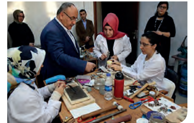
Gümüş takı işleme atölyesi

Ebru, Feretiko (Rize bezi Dokuma) Cam Yaldızlama Yemek Sunum - Pastacılık Dikiş - Mefruşat Tezhip Hat Minyatür Çini Takı işleme Kilim Dokuma Kuyumculuk Kuaförlük