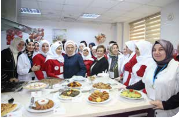
Aşçı Yardımcılığı kursu

Dikiş, aşçı yardımcılığı, kuaförlük, bilgisayar, çocuk bakıcılığı, hediyelik eşya hazırlama, özel bakım elemanı branşlarında haftanın beş günü eğitim verilmektedir. Branş eğitimlerinin yanı sıra Suriyeli öğrencilere yönelik Türkçe dersleri de verilmektedir. Eğitime katılan öğrencilere İşkur tarafından günlük 25 tl ödeme yapılmaktadır.