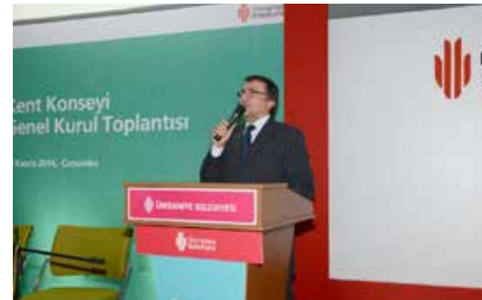
» Kent Konseyi Genel Kurulu