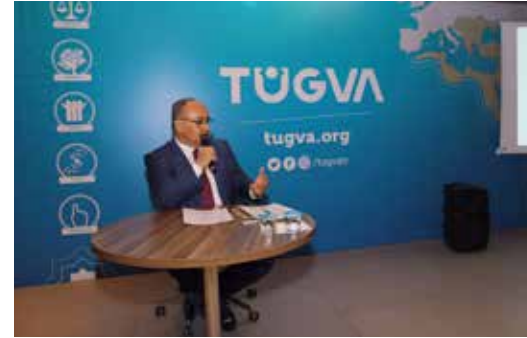
» Tugva Söyleşi Programı

Ümraniye Belediyesinin başkanımızın önderliğinde yaptığı başarılı çalışmaları birçok kesimin ve kurumun ilgisini çekmeye devam etmektedir. Bu sebepten birçok kurum ve kuruluş başarı öykümüzü dinlemek için başkanımıza davette bulunmaktadır. Sayın Başkanımız biriktirmiş olduğu başarı dolu yılları, gelişen Türkiye'mize bir tuğla daha koymak adına tam bir içtenlikle diğer kurum ve kuruluşlara aktarmıştır.