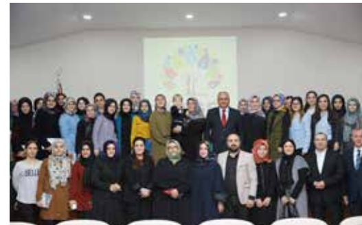
» TÜRGEV'de öğrencilerimizle hatıra fotoğrafı çekti.