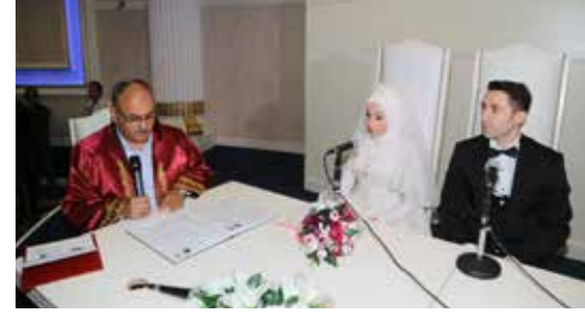
» Sayın Başkanımız vatandaşlarımızın nikah ve düğün törenlerine katılmıştır.

Vatandaşlarımız tarafından bizzat başkanımıza takdim edilen, müdürlüğümüze iletilen veya birçok elektronik mecradan ulaştırılan davetler titizlikle takip edilmekte ve başkanımızın programını en verimli şekilde kullanabilmesi için organize edilmiş ve katılım sağlanmıştır. Başkanımız veya başkanlık makamı tarafından görevlendirilen başkan yardımcılarımız davetlere icabet ederek çiftlerimizin ve yakınlarının mutlu günlerinde yanlarında olmuşlardır.