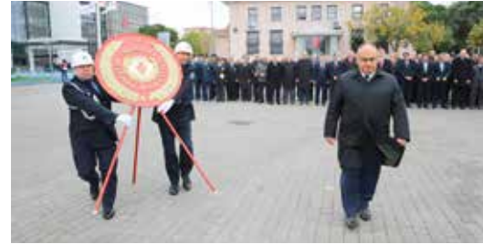
» 29 Ekim Resmi Töreni

Dini bayramlarda vatandaşlarımızla bayramlaşmalar düzenlenmiş, başkanımız binlerce Ümraniyeliyle bayram coşkusunu birlikte yaşamıştır. İkramlarla süslenen bu özel günlerde özellikle çocuklarımız unutulmamış onlara hediyeler verilmiş, ihtiyaç sahiplerine yapılan yardımlarla dini günlerin manevi iklimi çok daha güçlü yaşanmış ve bayramın toplumumuzun her kesimine ulaşması böylelikle sağlanmıştır.