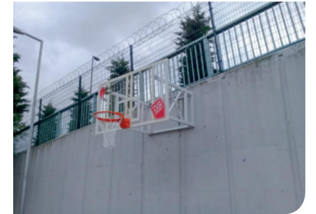
Nevzat Ayaz Anadolu Lisesi