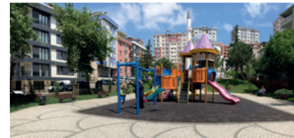
Şeyh Edebalı Parkı