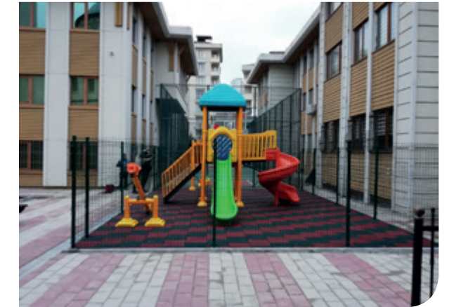
Ümraniye Müftülük Bahçesi

Her yıl olduğu gibi bu yıl da okullar, camiler, muhtarlıklar ve diğer kamu kurum ve kuruluşlarına çeşitli yardımlarda bulunulmuştur.