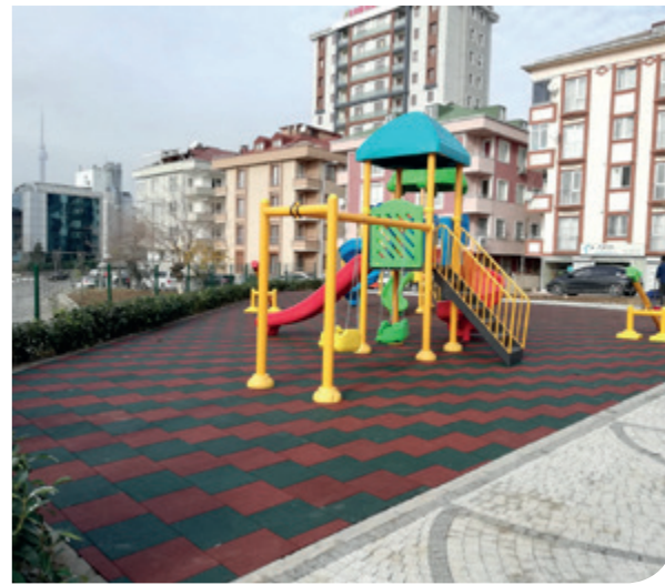
Esenevler Mah. İnşirah sk

Ümraniye Belediyesi genel belediye hizmetlerini düzenli bir şekilde yürütürken, ilçenin gelişimini şekillendirecek ve görsel zenginlik katacak bazı hizmetlere öncelik vermiştir. Bunlar; çocuklarımızın sağlıklı ve güven içerisinde oyun oynayabileceği, eğlenebileceği, gençlerimizin spor aktivitelerini rahatça yerine getirebileceği, farklı yaş gruplarındaki vatandaşımızın huzur içinde oturabileceği, dinlenebileceği, adeta bir buluşma, tanışma, kaynaşma noktası haline gelen park ve yeşil alanlarımızın sayısını arttırmaktır. Bu hizmetleri yaparken de ulaşımı kolay, çevreyle uyumlu ve erişilebilir nitelikte olmasına dikkat edilmiştir. Bu doğrultuda müdürlüğümüz, 2018 yılında yapılan yeni parklarla birlikte toplam yeşil alan miktarını 925.525,31 m 2 ye çıkarmıştır.