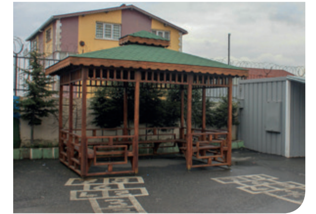
Şehit Onur Kılıç İlkokulu