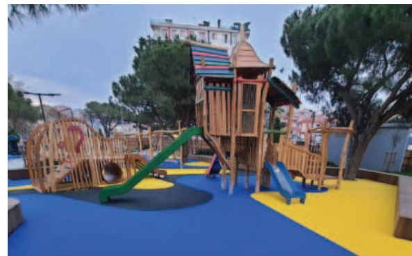
Sevgi Parkı Revizyonu