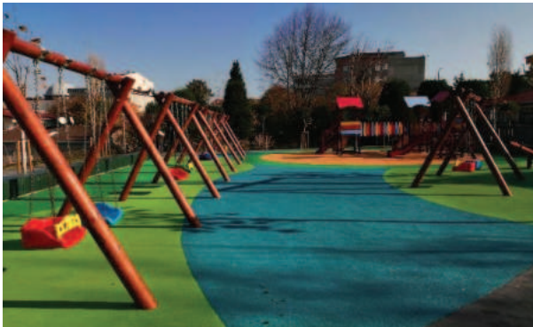
Karabekir Parkı Revizyonu