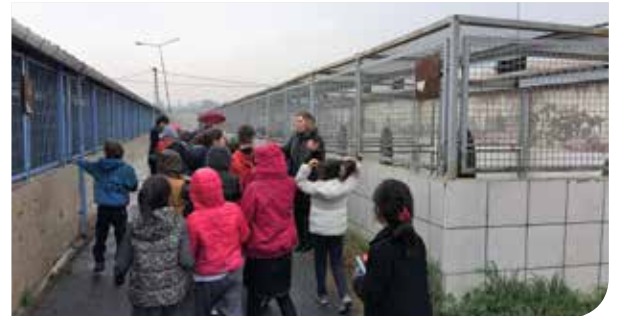
• Geçici Hayvan Bakımevi Ziyaretleri

Gerekli önlemler alınmadığı takdirde bu hastalıklardan ölümler meydana gelmektedir. Tüm hayvan türlerinde görülebilen zoonozlar; bakteriyel, paraziter, viral ve mantar kaynaklı olabilmektedir. Temas, kan yolu, ısırma, tırmalama ve solunum yolu ile bulaşma olabilmektedir.