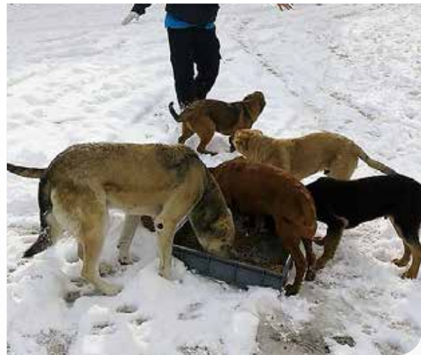
• Kış Çalışmaları

Müdürlüğümüz, kış aylarında yiyecek bulmakta zorlanan sokak hayvanlarını yemleme çalışmalarını sürdürdü.