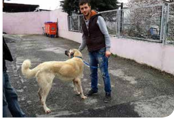
• 2017 yılında 288 hayvan sahiplendirilmiştir.

Sahiplendirilemeyen rehabilite edilmiş işaretilenmiş hayvanlar 5199 Sayılı Hayvanları Koruma Kanunu ve Hayvanların Korunmasına Dair Uygulama Yönetmeliğine göre belgelenip, alındığı ortama geri bırakılmaktadır.