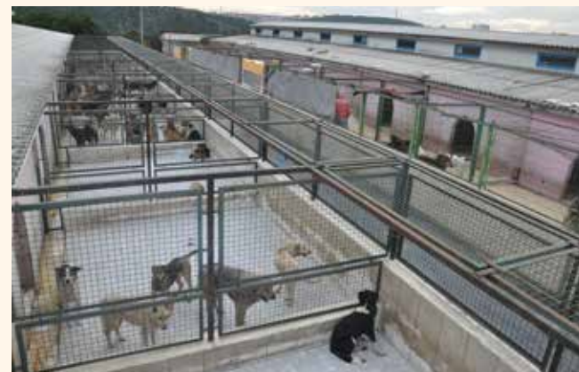
» Geçici Hayvan Barınağı

Veteriner İşleri Müdürlüğü belediye ana hizmet binasında, veterinerlik faaliyetleri ise ayrı olarak Hekimbaşındaki rehabilitasyon merkezinde verilmektedir. Müdürlük bünyesinde 1 memur, 4 Veteriner Hekim ve 11 işçi görev yapmaktadır.