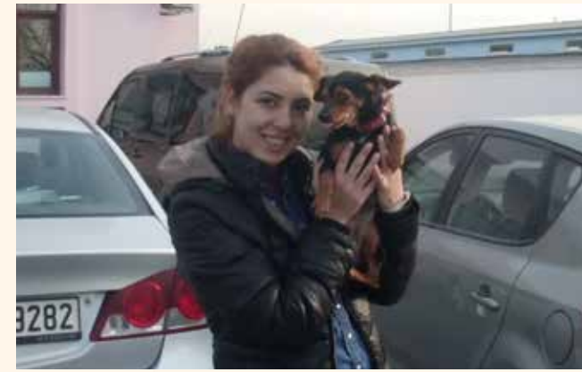
» 2013 yılında 200 hayvan sahiplendirilmiştir

Dünyada hayvanlardan insanlara bulaşan 200'e yakın zoonoz hastalık mevcuttur. Bunlardan 50 tanesi ülkemizde görülmüştür. Gerekli önlemler alınmasa bu hastalıklardan büyük verim kayıpları ve ölümler meydana gelmektedir. Tüm hayvan türlerinde görülebilen zoonozlar; bakteriyel, paraziter, viral ve mantar kaynaklı olabilmektedir. Temas, kanyolu, ısırma, tırmalama ve solunum yolu ile bulaşma olabilmektedir.