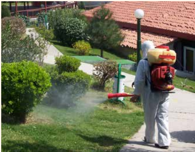
» İlaçlama Çalışmaları

274 adet lokal acil ilaçlama şikayeti, ekiplerimiz tarafından müdahale edilerek giderilmiştir.