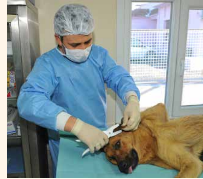
» Geçici Bakım Evi ve Rehabilitasyon Merkezi Muayenehanesi