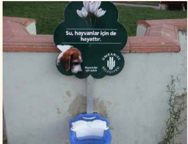
» Sulukların yaygınlaştırılması hedeflenmektedir.

İlçemizdeki 23 adet parka hayvanların özellikle yaz sıcaklarında susuz kalmaması için suluk yerleştirilmiştir.