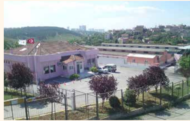
» Hayvan Bakım ve Rehabilitasyon Merkezi

Hekimbaşında bulunan tesis, İstanbul'da kurulan ilk barınaklardan olup temizliği, bakımı ve çevre düzenlenmesi ile diğer barınaklara örnek olacak niteliktedir. Burada hayvanlara her türlü veterinerlik hizmeti verilmektedir. Toplanan sahipsiz sokak hayvanları gerekli bakım ve rehabilitasyon işlemlerinden sonra sahiplendirilir. Sahiplendirilmeyen hayvanlar, alındıkları ortama geri bırakılır. Sahipsiz, yaşlı ve saldırgan hayvanlar ise barınakta gözetim altında tutulmaktadır. Ekipler, sorumlu veteriner hekimler tarafından eğitilip, toplama işlemi veteriner hekim kontrolü altında usulüne uygun olarak yapılmaktadır.