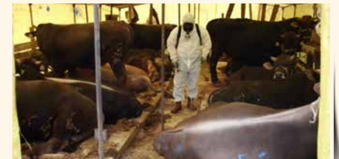
» Dezenfekte Çalışmaları

Sağlıklı bir toplum oluşturulmasında; hayvan sağlığı korunması, halkın yeterli ve güvenli gıdayla beslenmesi hususu büyük önem arz etmektedir. Kurban Bayramı süresince ilçemize gelen tüm hayvan satış ve kesim yerleri, ortak kullanıma açık kamusal alanlar ve risk teşkil edebilecek her yer ilaçlanıp dezenfekte edilmiştir.