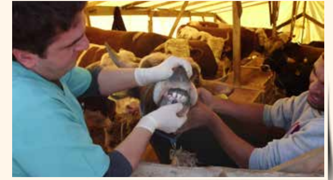
» Kayıt ve Muayene Çalışmaları

Kurban Bayramı döneminde, kurbanlık hayvan satış yerlerine gelen tüm hayvanların muayene ve sağlık kontrolleri yapıp, kayıt altına alınmıştır. Herhangi bir salgın hayvan hastalığının çıkarmaması için hayvan satış ve kesim yerleri periyodik olarak ilaçlanarak dezenfekte edilmiştir. Bayramı huzur ve sükunet içerisinde geçiren ilçemizde bayram süresince her türlü veterinerlik hizmeti verilmiştir.