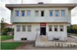
DUMLUŞINAR GENÇLİK KÜLTÜR VE EĞİTİM MERKEZİ Dumluşınar Mah. Malatya Cad. No: 82 Tel: 0 (216) 630 61 77