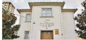
YUNUS EMRE BİLGİ EVİ Çakmak Mah. İktbal Cad. No:6 Tel: 0 (216) 466 21 85