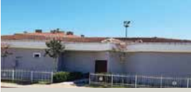
AHMET CEVDET PAŞA EĞİTİM MERKEZİ Atakent Mah. Orhan Veli Sok. No:5A Tel: 0 (216) 521 73 60