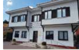
SABAHATTİN ZAIM YAPAY ZEKA VE İNOVASYON MERKEZİ Çakmak Mah. Baraj Sok. No: 68 Tel: 0 (216) 313 72 17