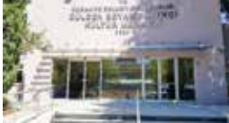
ENGELLİLER KÜLTÜR VE EĞİTİM MERKEZİ Site Mah. Senol Güneş Bulvarı No:76 Tel: 0 (216) 533 56 56