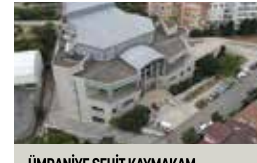
ÜMRANİYE ŞEHİT KAYMAKAM MUHAMMED FATİH SAFİTÜRK KÜLTÜR MERKEZİ Atakent Atakan Cad. Üstündağ Sok. No:2 Tel: 0 (216) 443 56 00 (1137)