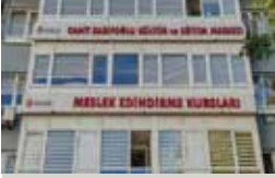
KAHİT ZARİFOĞLU KÜLTÜR VE EĞİTİM MERKEZİ Atatürk Mah. Alemdağ Cad. No:20 Tel: 0 (216) 328 35 39