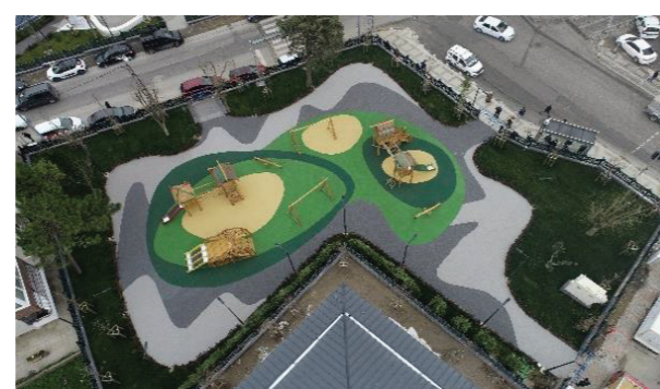
Atatürk Mahallesi Mevlana Parkı