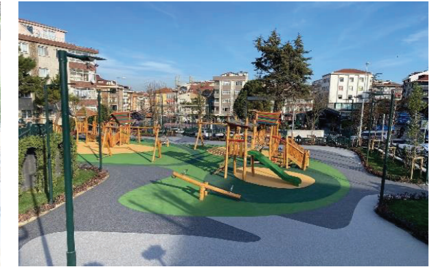
Mevlana Parkı Revizyonu