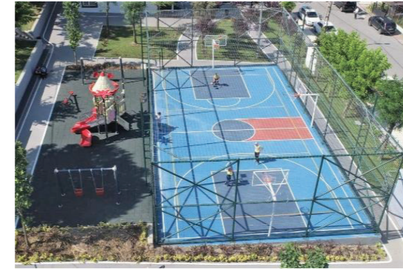
Karacaoğlan Parkı Revizyonu