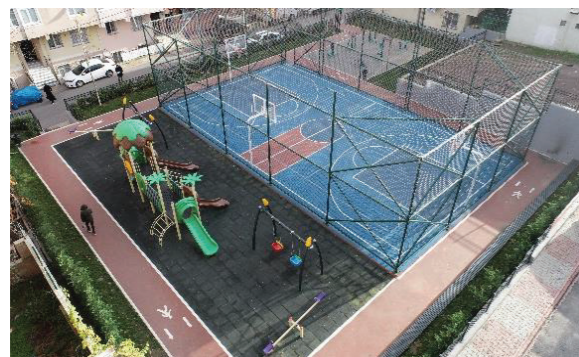
Esenşehir Mahallesi Zambak Parkı

İlçede yeşil alan ve rekreasyon alanı miktarını artırmak ve mevcut yeşil alanların bakım onarımını yaparak korunmasını sağlamak.