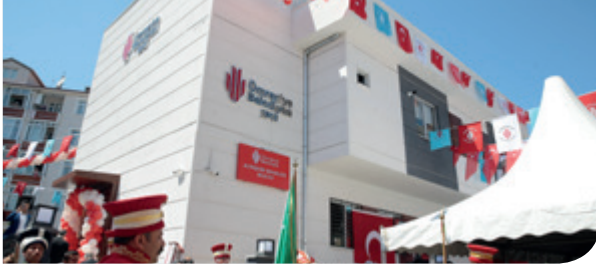
Altınşehir Mahalle Muhtarlığı

İçemizin 35 Mahalle Muhtarlığından, 30 adet Muhtarlık binası Belediyemiz tarafından yapılmıştır, 04/01/2018 tarih ve 2018/15 sayılı Belediye Meclis kararı ile Site Mahallesi'nin yerine Site, Yenişehir ve Finanskent adında 3 mahalle kurularak mevcut mahalle sayısına ilave olarak iki mahalle daha kurulması akabinde ilçemizin mahalle sayısı 37 olmuş olup; bu mahallelerimizden yeni kurulan Yenişehir ve Finanskent mahalleleri haricinde, Muhtarlık Binası olmayan mahallemiz kalmamıştır. Bu kapsamda Belediye Başkanlığımızca, Mahalle Muhtarlık binalarımızdan önceki dönemlerde yapılan binaların yenilenmesi ihtiyacı nedeniyle yeni yerlerinde yapımı devam eden Altınşehir ve İnkılap Mahalle Muhtarlık binalarımız 2018 yılında tamamlanarak hizmete açılmıştır.