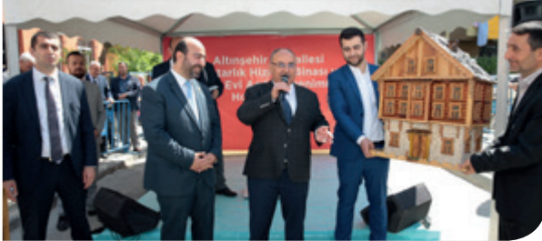
Altınşehir Mahalle Muhtarlığı