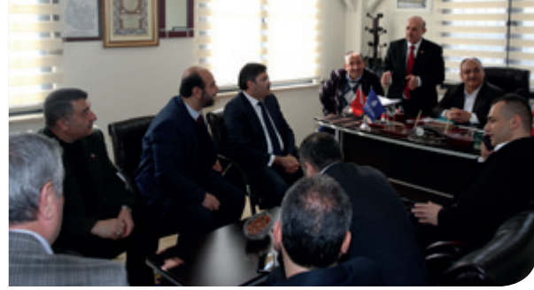
Başkanımızın Ademyavuz Mahallesi Muhtarlığını Ziyareti

Belediye Başkanlığımızın planlamış olduğu muhtarlık ziyaretleri ve istişare toplantıları yapılmış, 35 muhtarlığımız ziyaret edilmiştir.