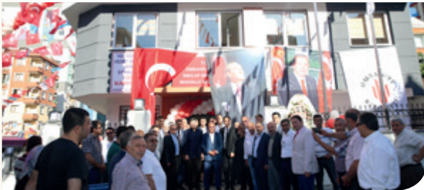
İnkılap Mahalle Muhtarlığı