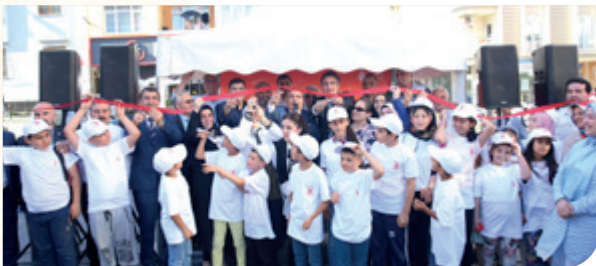
İnkılap Mahalle Muhtarlığı