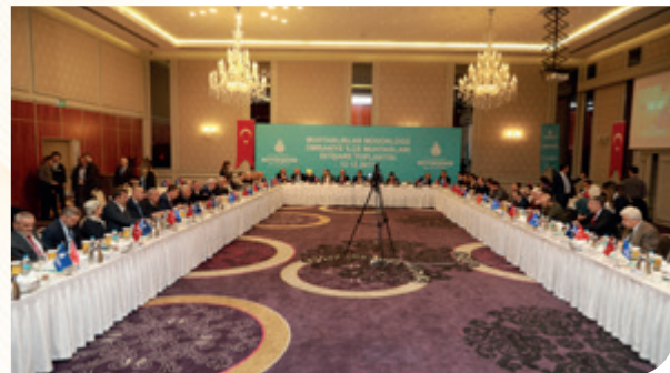
İstanbul Büyükşehir Belediyesi Ümraniye İlçe Muhtarları İstişare Toplantısı

İstanbul Büyükşehir Belediyesi Muhtarlık İşleri Müdürlüğü tarafından Ümraniye İlçe Muhtarları İstişare toplantısı 04/12/2018 tarihinde Florya Sosyal Tesislerinde yapılmıştır.