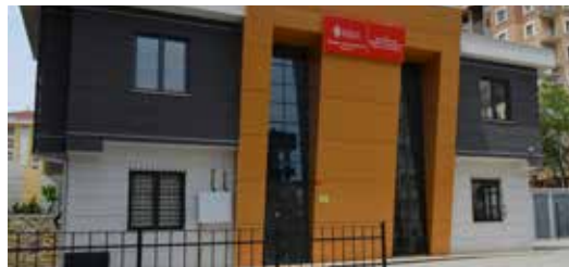
» Mehmet Akif Mahallesi Muhtarlık Hizmet Binası