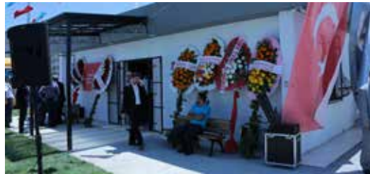
» İhlamurkuyu Mahallesi Muhtarlık Hizmet Binası