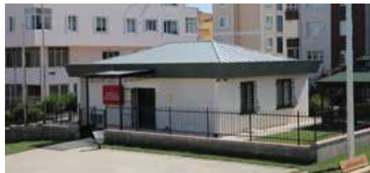
» Tepeüstü Mahallesi Muhtarlık Hizmet Binası