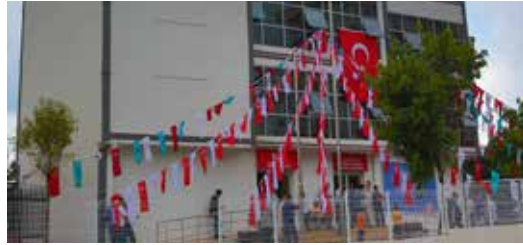
» Esenkent Mahallesi Muhtarlık Hizmet Binası