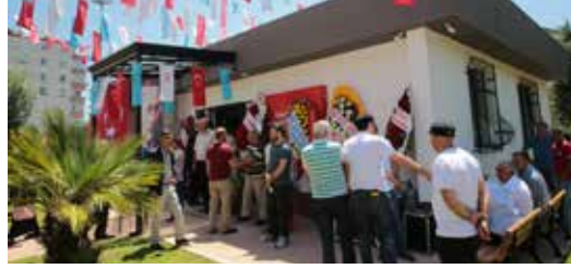
» Elmalikent Mahallesi Muhtarlık Hizmet Binası

2016 yılında 5 adet Mahallemizin Muhtarlık binasının yapımı tamamlanmış olup; Muhtarlık Binası olmayan mahallemiz kalmamıştır.