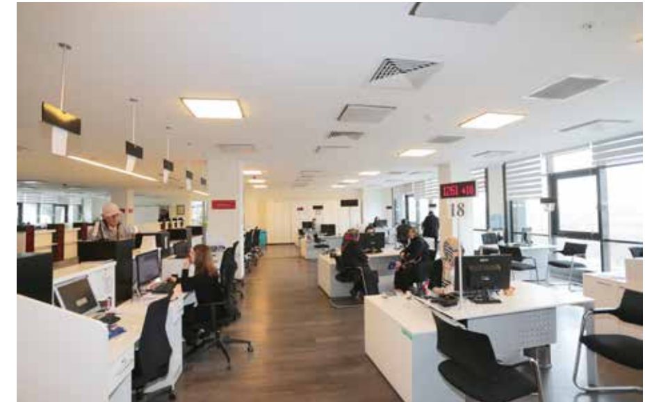
» Kentli Servis

Gelir bütçesi incelendiğinde Vergi Gelirleri % 44,58 gerçekleşme oranı ile 145.486.672,95 TL olarak gerçekleşmiştir. Teşebbüs ve Mülkiyet Gelirleri % 8,51 gerçekleşme oranı ile 27.754.252,75 TL olarak, Alınan Bağış ve Yardımlar % 0,52 gerçekleşme ile 1.709.796,77 TL olarak, Diğer Gelirler % 46,39 gerçekleşme ile 151.373.717,31 TL olarak gerçekleşmiştir.