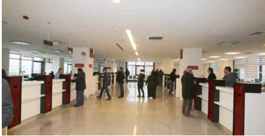
» Emlak Servisi