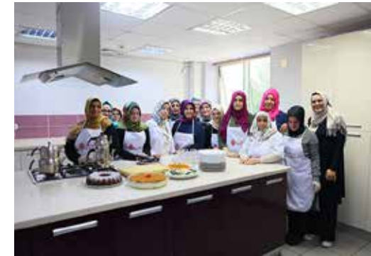
» Aşçı Yardımcılığı Kursu

5 branşta uygulamalı olarak verilen eğitimler, işinde uzman eğitmenler tarafından verilmektedir. Katılım sağlayan kursiyerlere günlük 20 tl eğitim destek ücreti verilmektedir. Kursiyerler evine en yakın güzergah-tan servis aracı ile alınmakta; eğitim sonrası adreslerine bırakılmaktadırlar.