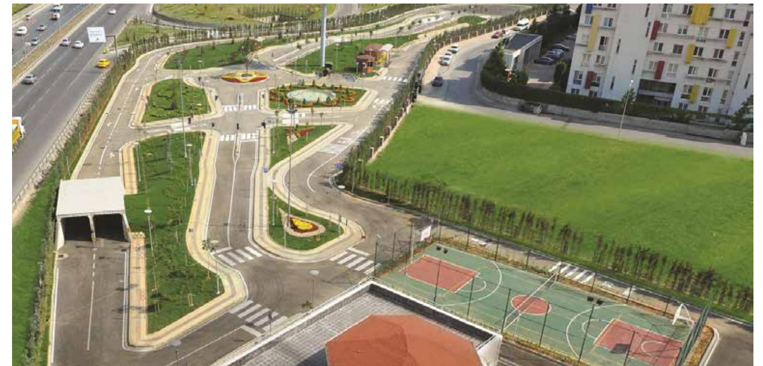
Trafik Eğitim Parkından Yararlanan Çocuk Sayısı

22 Mart 2013 tarihinden bu yana bir kompleks halinde hizmet veren Trafik Çocuk Eğitim Parkı bünyesinde çocuklara trafik eğitimi verilmekte olup, bir dönem buz pisti eğitimi de verilmiştir. Ayrıca parkımız içerisinde basketbol ve futbol sahası da bulunmaktadır. Bir dönem faaliyet gösteren buz pistimiz 19 Eylül 2013'e kadar 18,828 öğrenciye hizmet vermiştir. 2016 yılında 7.028 öğrenciye hizmet verilmiştir.