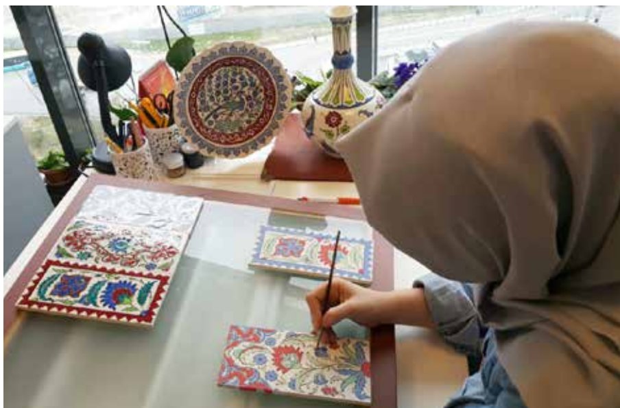
» Çini Atölyesi

MESLEK EDİNDİRME KURSLARI Meslek Edindirme Kurslarımızda, 17 yaş üstü yetişkinlere yönelik ücretsiz kurslar düzenlenmektedir. Kültür merkezlerimiz, bilgi evlerimiz ve Gülden Soyan Engelli Merkezinde yapılan kurslarımızdaki eğitimlerimiz; hasta ve yaşlı bakımı, feretiko (rize bezi dokuma), mefruşat, iğne oyası, tezhip, cam yıldızlama, giyim, abiye giyim, bilgisayar, el sanatları, rölyef, el nakışı, kurdele nakışı, makine nakışı, kalem işi, yabancı dil (arapça), modelistlik, stilistlik, ebru, minyatür, hat, yemek sunum, pastacılık ve pastane ürünleri, gümüş takı işlemciliği, resim, dantel anglez, çocuk gelişimi, ilkyardım, takı tasarım olmak üzere 29 branşta yapılmaktadır.