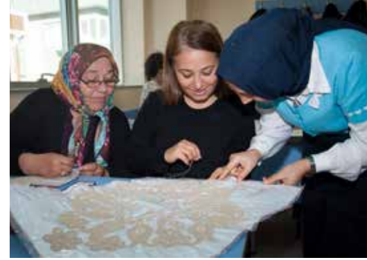
» Dantel-Anglez Sınıfı

Yıl sonunda müdürlüğümüz bünyesinde düzenlenen kurslarda eğitim gören öğrencilerin eserlerinin sergilendiği yerel sergi, genel sergi ve defile etkinlikleri düzenlenmektedir.