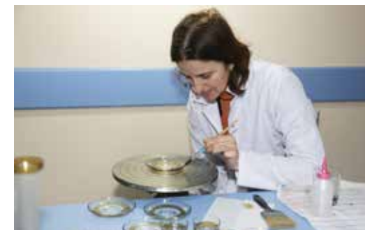
» Cam Yıldızlama Atölyesi

2016 yılında Meslek Edindirme Kurslarımızda Ebru, Feretiko (Rize bezi Dokuma), Cam Yıldızlama, Yemek Sunum, Mefruşat, El Sanatları, Tezhip, Hat, Minyatür, Çini, Takı işleme konularında atölye çalışmalarımız gerçekleştirilmiştir.