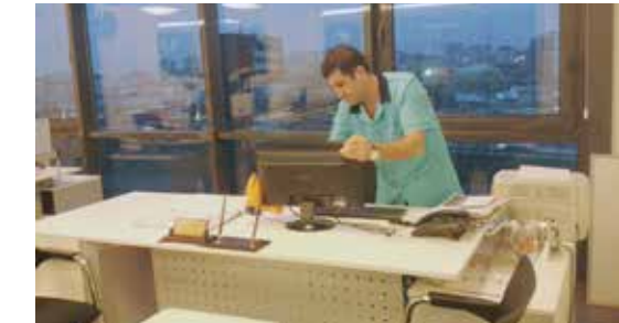
Ofis alanlarının temizliği hergün düzenli olarak yapılmaktadır.

Temizlik personeli tarafından hizmet binasındaki protokol girişi, meclis salonu önü, başkan ve başkan yardımcısı odaları ile müdür odalarının da bulunan halılar günlük olarak süpürülerek temizlenmiştir. Temizlik personeline meclis günlerinde, 460 m 2 olan Meclis salonunun halı zeminini temizlenmiş ve masalar silinerek meclis görüşmelerine hazır hale getirilmiştir.