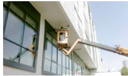
Dış Cephe Bakımı