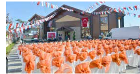
Açılış ve program ön hazırlıkları

İlçe genelinde yerel seçimler sonrası asılan pankart, afiş ve bayraklar toplanmıştır.