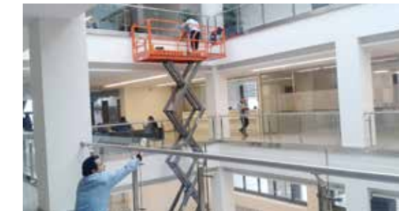
İç mekan temizliği

Toplam 8.002 m 2 parke zemin her gün paspas ile temizlenmiştir. Toplam 6.079 m 2 olan koridor ve merdivenleri günlük olarak yıkanarak temizlenmiştir. Başkanlık ve ikinci katta bulunan korkuluk camları makaslı vinç ile her ay temizlenmiştir. Belediye İmar ve kurum arşivi günlük olarak temizlenmiştir. Hafta sonlarında yoğunluğa binaen nikah sarayında otopark, Tantavi Sosyal Tesisinde ise garsonluk hizmeti destek olarak verilmiştir.