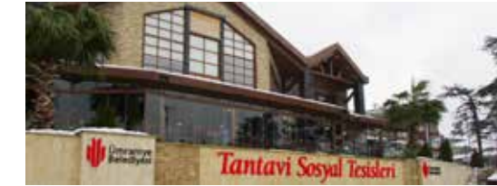
» Tantavi Sosyal Tesisi

2016 yılında belediyemizin kira ve ecr-i misil gelirleri tahakkuku Toplam 8.192.879,04 TL dir.