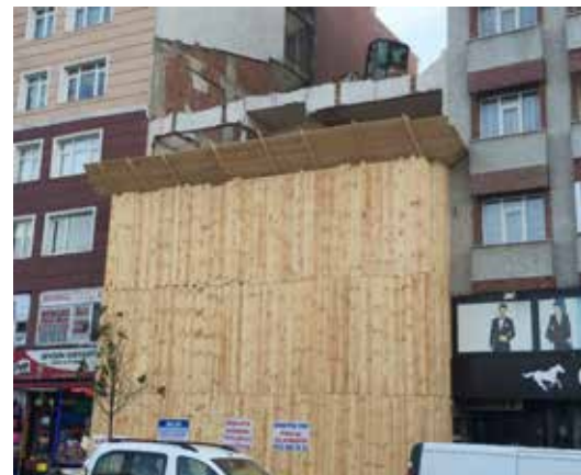
» Risk oluşturan yapılar kentsel dönüşüm kapsamında yenilenmektedir.

Ayrıca ilgili kanuna istinaden boşaltılmış binaların, can ve mal güvenliğini tehdit etmesi adına, bina etrafının çevrilmesi, gerekli tüm güvenlik önlemlerinin alınması doğrultusunda ilgililerine uyarı, tebligat ve denetimleri müdürlüğümüz tarafından yapılmaktadır.