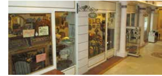
» Sanatkarlar Çarşısı

Müdürlüğümüzde 2016 yılında 14 adet yeni kiralama ihalesi olmak üzere toplam 30 adet taşınmaz için kira uygulaması yapılmış olup; 1.921.999,04 TL tahakkuk oluşturulmuştur.