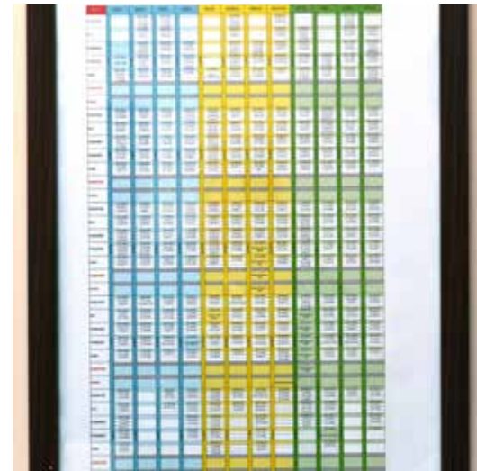
» Yıllık Periyodik Bakım Planı

Araç ve iş makinelerimizin tamamını kapsayan koruyucu ve önleyici bakım çalışmalarımız, her bir araç için yıl içinde belirli periyotlarla 3 defa gerçekleştirilmiştir. Böylelikle muhtemel arızalar önlenmiş, iş ve zaman kayıplarının önüne geçilerek işletme maliyetlerimiz minimum düzeyde kalırken günlük faal araç oranımızın yüksek bir oranda gerçekleşmesi sağlanmıştır.