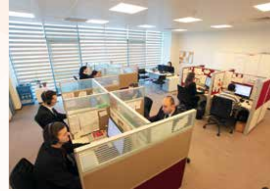
» Çağrı Merkezi Ofisi