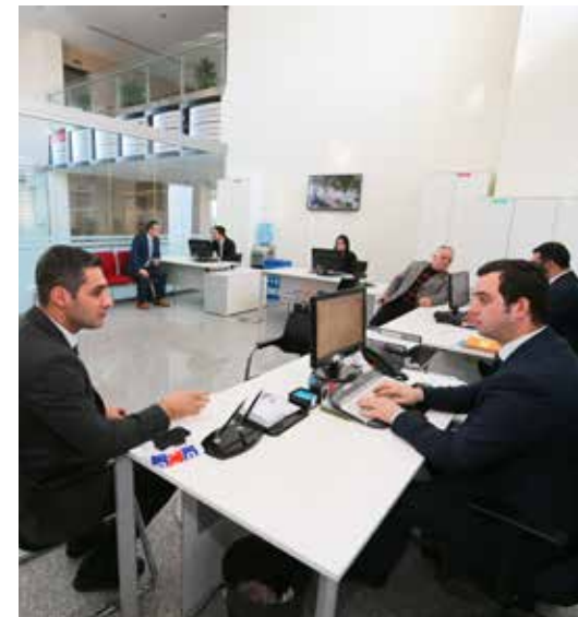
» Çözüm Merkezi

BİMER ve Bilgi Edinme müracaatları da Çözüm Merkezimiz tarafından işleme alınıyor.