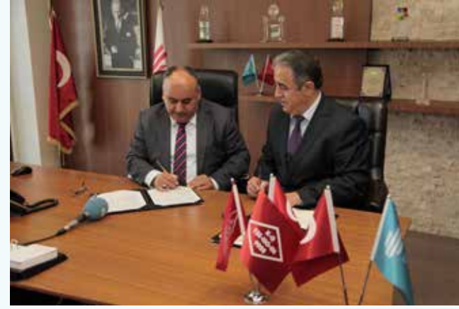
» 25.09.2013 / TSE Protokol

Belgelendirme süreci boyunca yapılan denetimler ve görüşmeler ile birlikte Belediyemizin kalite odaklı yönetim anlayışı Türk Standartları Enstitüsü (TSE) denetçilerinden tam not almıştır. Belediyemizin yönetim sistemi TSE tarafından TS EN ISO 9001 Kalite Yönetim Sistemi kapsamında belgelendirilmiştir.