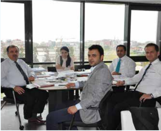
» 26.04.2013 / Çalıştay