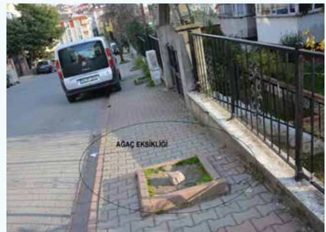
» Atakent Mahallesi, Burç Caddesi