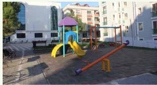
» Esenevler Mahallesi Eryuvam Parkı-YENİ