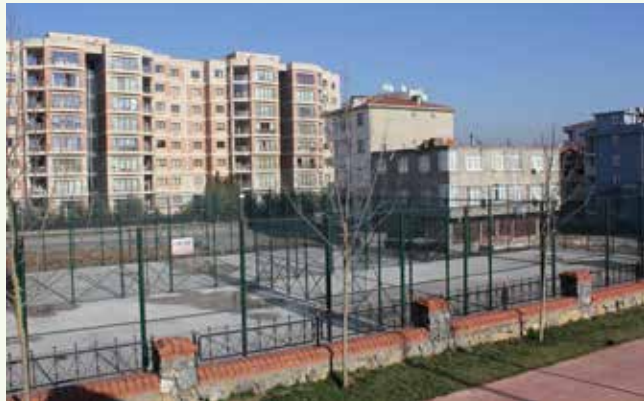
» Madenler Mahallesi-Spor Sahaları

2013 yılında da hem yeni spor alanları oluşturulmuş hem de mevcut parkların içerisindeki basketbol sahalarında yenileme ve iyileştirme çalışmaları yapılmıştır. Madenler Mahallesinde 3 adet spor sahası yapılmış , Dere Parkı, Karacaoğlan Parkı, Şair Zihni Parkı, Ekrem İsmailoğlu Parkı, Kumru Parkı, Manolya Parkı, Ahmet Yüksel Özemre Parkı, Goncağül Parkı, Arif Nihat Asya Parkı, Ata Parkı, Çakmak Parkı, Elmalıkent Parkı, Seyit Onbaşı ve Remzi Öztürk Parklarına basketbol sahası, pota ve tel örgü imalatları yapılmıştır.