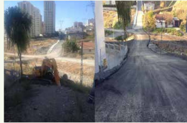
» Göksu Caddesi Önce-Sonra