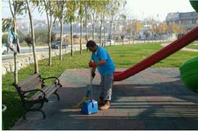
» Parkların Düzenli Bakımı

Ümraniye İlçe Sınırları dahilindeki tüm parklar, yeşil alanlar ve refüjlerdeki çim ekimi ve biçimi, yabancı ot temizliği, havalandırma, gübreleme ve çapalama gibi faaliyetleri, bu alanlarda bulunan tüm donatıların, bakımı ve onarımı, hizmet işi kapsamında müdürlüğümüz tarafından yapılmış yada müdürlüğümüz kontrolünde yaptırılmıştır. Bir hizmeti yapmak kadar onu korumak ve yaşatmak da önemlidir. Her türlü detayın dikkate alındığı bakım onarım çalışmaları; parkların ve Ümraniye İlçe sınırlarındaki diğer yeşil alanların daha kullanışlı hale gelmesini sağlamakta ve ilçemize nezih ortamlar sunmaktadır.