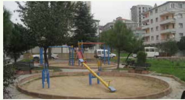
» Esenevler Mahallesi Eryuvam Parkı-ESKİ

Müdürlüğümüz bakım-onarım çalışmaları yanında mevcut parkları yenileyerek geliştirmektedir. 2013 yılında Eryuvam Parkı komple yenilenmiş, diğer taraftan mevcut parklarımıza da kent mobilyaları, açık hava spor aletleri, çocuk oyun grupları gibi yeni üniteler eklenerek hizmete sunulmuştur.