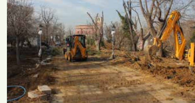
» Av Köşkü Çevre Düzenlemesi