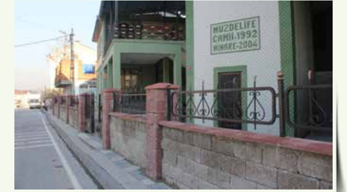
» Müzdelife Camii Bahçe Düzenlemesi

İlçe sınırları içerisindeki muhtelif camilerin bahçelerinde çevre düzenlemeleri yapılmıştır.