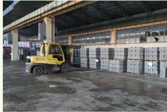
» Lojistik Depo

4.000 m 2 kapalı alanlı ve 9.000 m 2 açık alanlı Lojistik Depoda; gerekli yapı malzemeleri depolanmaktadır.