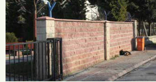
» Atakent Polis Karakolu Duvar Yapımı