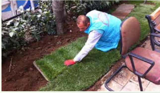
» Çim Serim Çalışması

Mevcut yeşil alanlarda, yeni çevre düzenlemesi yapılan alanlarda ve yıpranmış çim alanlarında gerek çim tohumu ekimi gerekse hazır olarak temin edilen rulo çimlerin serilmesi, bakımı, biçilmesi, kuruyan yerlerin çıkarılarak yenilenmesi gibi çalışmaları kapsamaktadır.