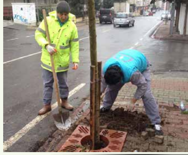
» Okay Caddesi Ağaç Dikimi Çalışması

Esenevler Mahallesi Yunus Emre Caddesi, İstiklal Mahallesi Oruç Reis Sokak, Cevahir Caddesi, Tezcan Caddesi'nde ağaçlandırma çalışmaları yapılmıştır.