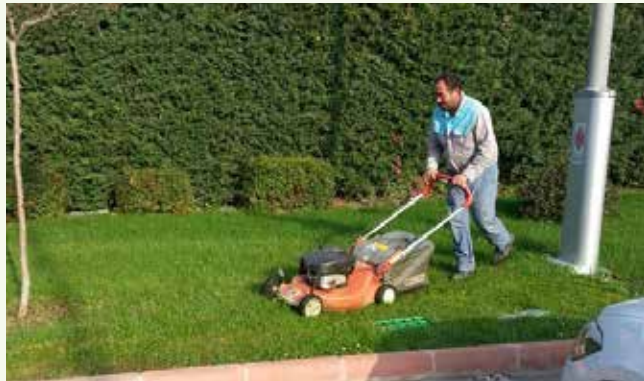
» Çim Biçim Çalışması