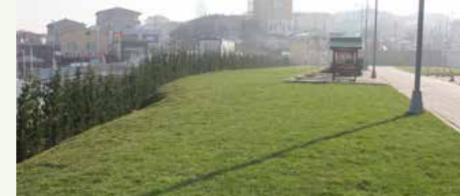
» Parseller Mahallesi Rehabilitasyon Merkezi