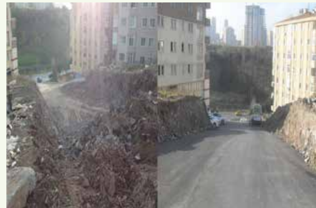
» Şahin Caddesi Önce-Sonra