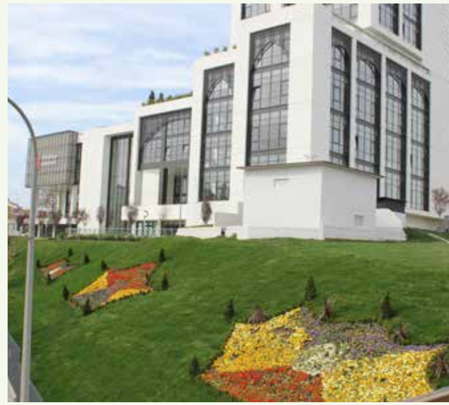
» Belediye Hizmet Binası Çevre Düzenlemesi

Ümraniye Belediyesi genel belediye hizmetlerini düzenli bir şekilde yürütürken, hem ilçenin gelişimini şekillendirip hem de görsel zenginlik katan hizmetler de sunmaktadır. İlçemizin gelişen fiziki yapısı, artan nüfusu ve yapılaşmasıyla birlikte meydana çıkan çevre kirliliğini önlemek, toplumsal yaşam alanlarında yapıların yeşille bütünleşmesini sağlamak ve vatandaşımıza doğanın güzelliklerini her özelliğiyle yansıtmak için her yıl olduğu gibi bu yıl da çevre düzenlemeleri ve yeşil alan tanzimi yapılmıştır. Muhtelif park, yeşil alan ve refüjlerde 46.400 m 2 yeşil alan tanzimi yapılmıştır.