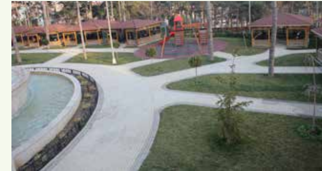
» Tantavi Sosyal Tesisleri Bahçe Alanı