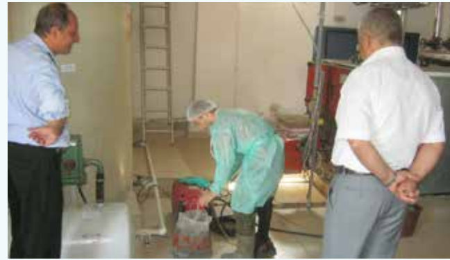
» Depo Temizliği

Belediyemiz hizmet binaları yanı sıra ilçemizdeki tüm okulların, camilerin, devlet hastanesinin su depoları her yıl olduğu gibi bu yılda belediyemiz tarafından dezenfekte ve temizliği teknik ele- manlarımız kontrolünde yapılmıştır.