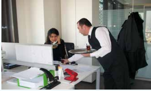
» Çay Servisi

Kat hizmetleri dahilinde bir diğer hizmet çay ocaklarının işletil- mesi. Çay ocaklarının işletilmesi, çay servisi de İşletme ve İшти- rakler Müdürlüğümüz tarafından organize edilmektedir.