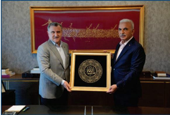
* Gençlik ve Spor Bakanımız Sayın Osman Aşkın BAK'ın Ümraniye Belediyesi Ziyareti

Başkanımız makamında kamu kurum ve kuruluşlardan bakanlar, milletvekilleri, belediye başkanları ve bürokratları ağırlayarak fikir alışverişinde bulunmuştur. Bu süreçteki tüm hizmetler Özel Kalem Müdürlüğümüz protokol ekibi tarafından yapılmaktadır.