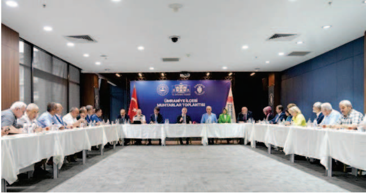
* İstanbul Valisi Davut Gül'ün iştirakiyle Muhtarlarla İstişare Toplantısı

Özellikle yakın çalışma halinde olduğumuz paydaşlarımız olan Kamu Kuruluşları, Hemşehri dernekleri ve Muhtarlarla sık sık bir araya gelerek proje ve faaliyetlerle ilgili müzakere toplantıları yapılmıştır.