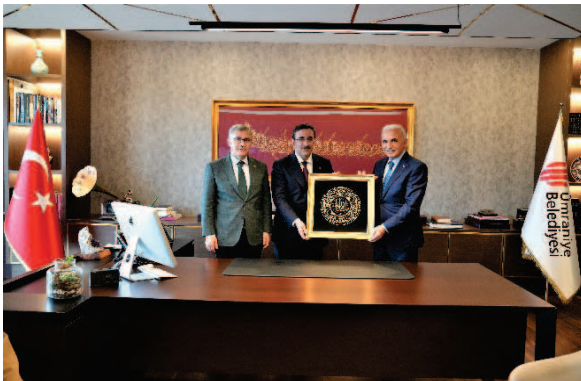
Cumhurbaşkanı Yardımcısı Sayın Cevdet Yılmaz'ın Ümraniye Belediyesi Ziyareti