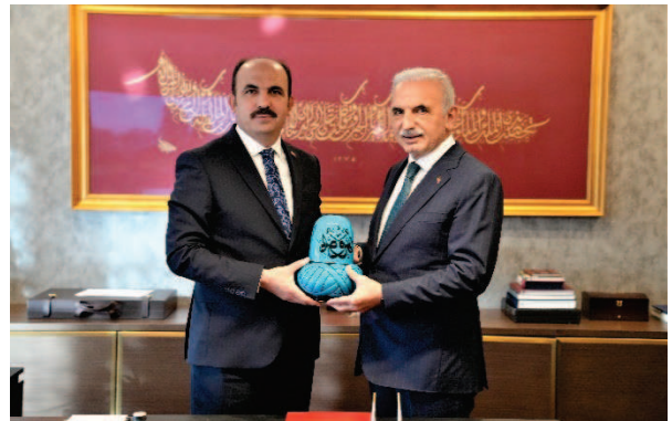
Konya Büyükşehir Belediye Başkanı Sayın Uğur İbrahim Altay'ın Ümraniye Belediyesi Ziyareti