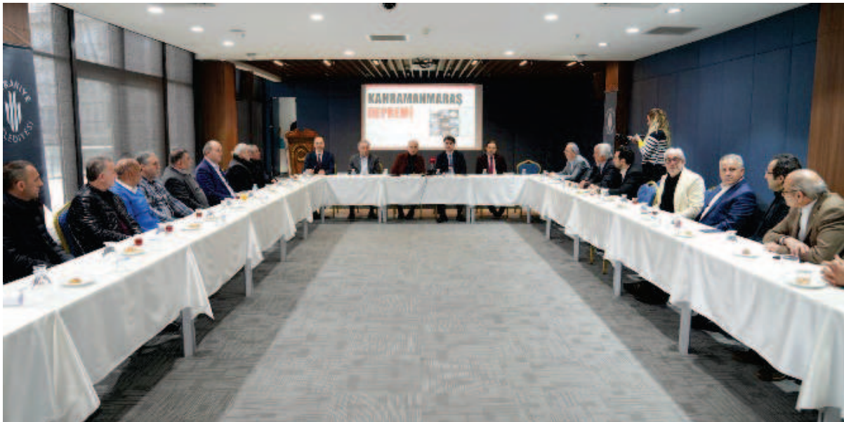
* İş Adamlarıyla, 6 Şubat'taki depremlerin etkilediği Kahramanmaraş'ın Onikişubat ilçesinde bulunan afetzedelerin gıda ihtiyaçlarını karşılamak amacıyla "Bir Koli de Sizden Olsun Kampanyası" tanıtım toplantısı