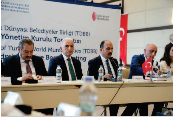
* Belediyemiz ev sahipliğinde Türk Dünyası Belediyeler Birliği (TDBB) yönetim kurulu toplantısı