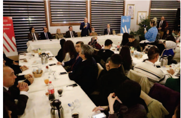
Ümraniye'ye yeni atanan öğretmenlerle Ümraniye'de eğitim konuşuldu.