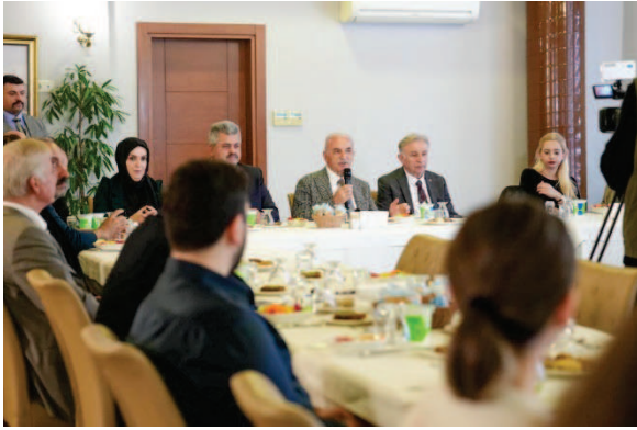
Paydaş Kurumlarla Ümraniye İklim Eylem Planı Müzakere Edildi.