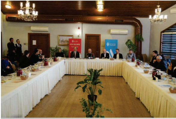
* Kültür Sanat Editörleriyle İstişare Toplantısı